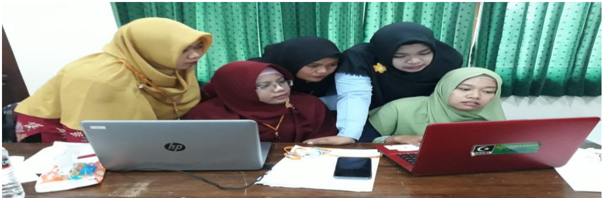
Peserta sedang aktif mendiskusikan materi