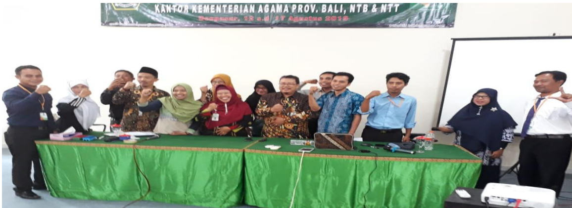
Peserta diklat Bersama widyaiswara usai melaksanakan diklat