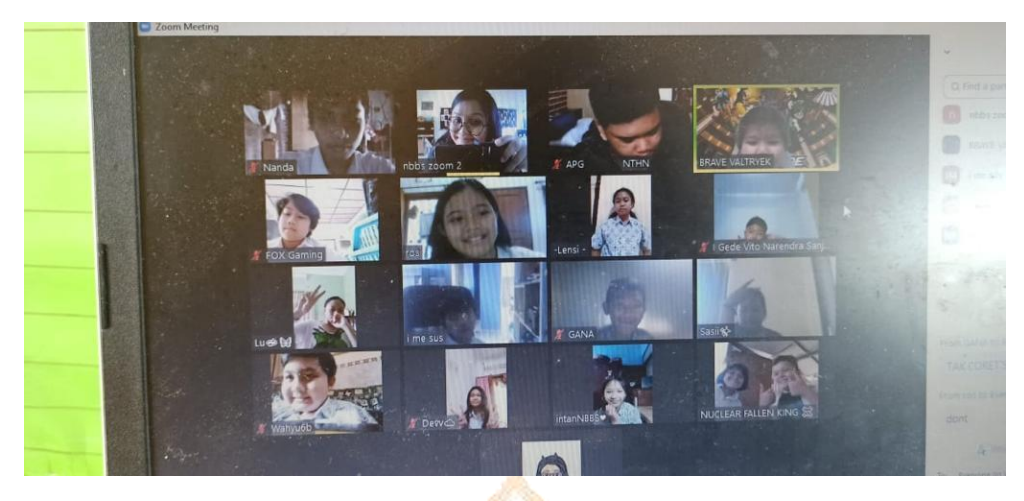
Appendix 6. The Implementation of Blended Learning System in Syncrhonous Mode