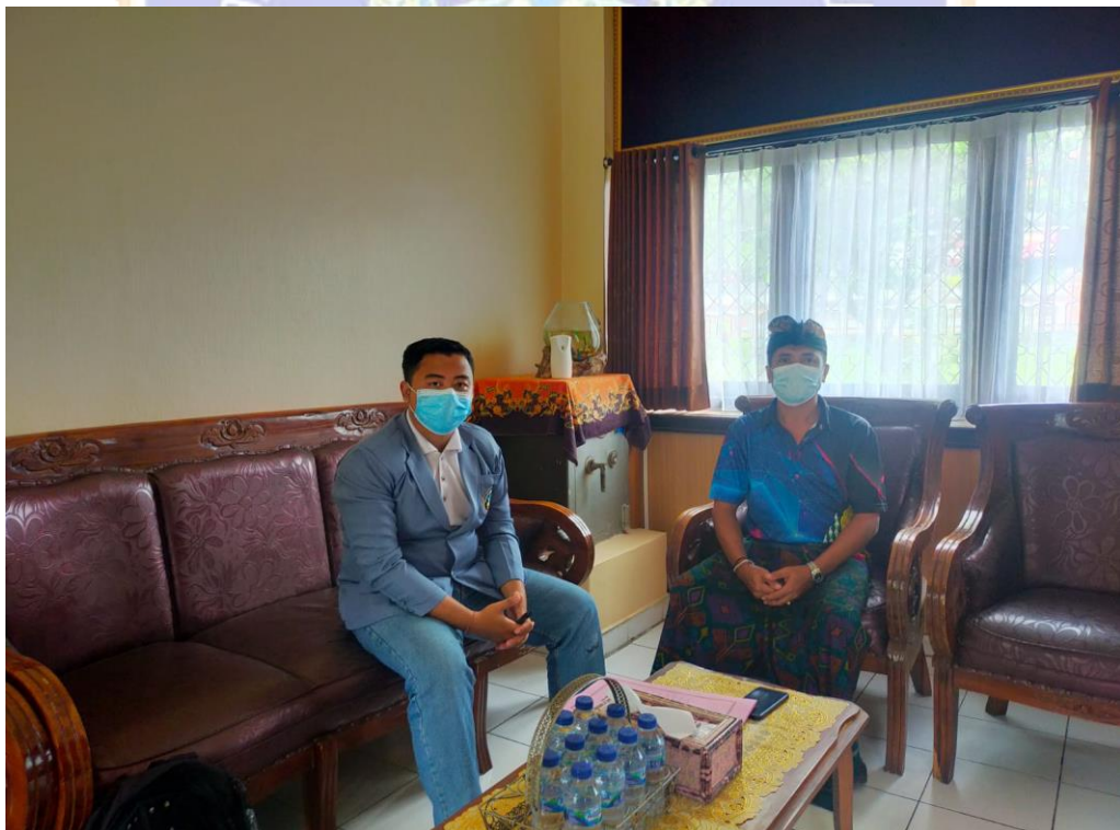
FOTO WAWANCARA DENGAN NARASUMBER II