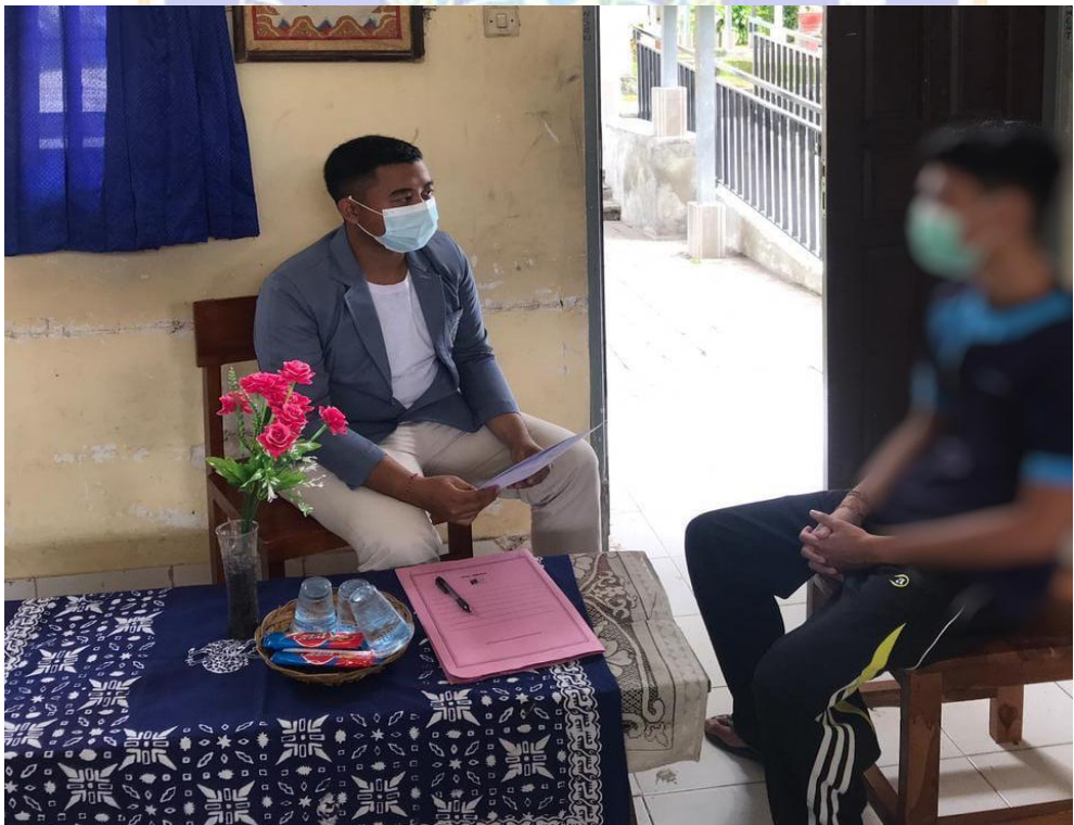
FOTO WAWANCARA DENGAN RESPONDEN II