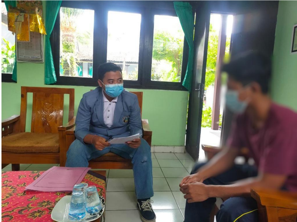
FOTO WAWANCARA DENGAN RESPONDEN III