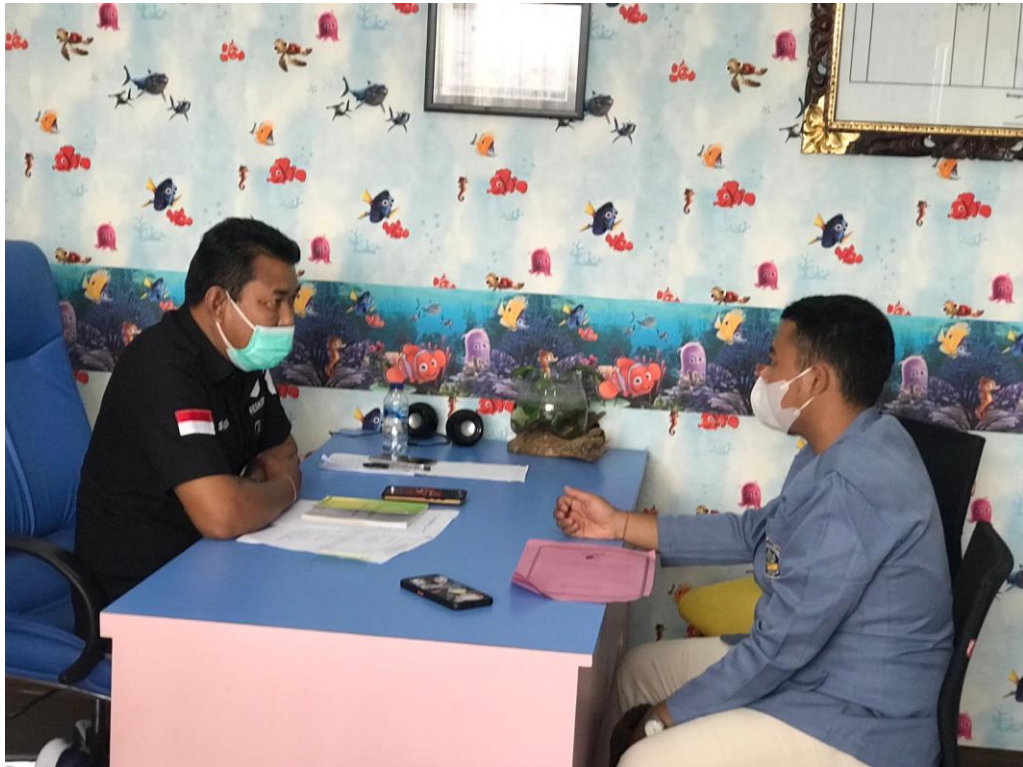
FOTO WAWANCARA DENGAN NARASUMBER I