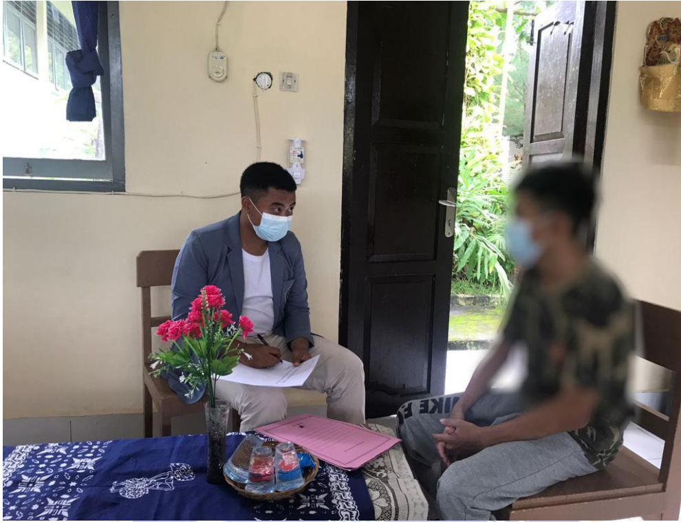
FOTO WAWANCARA DENGAN RESPONDEN I