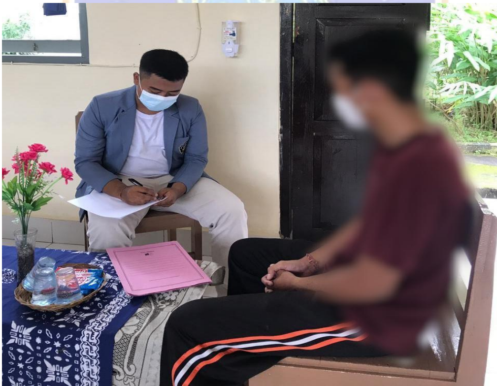
FOTO WAWANCARA DENGAN RESPONDEN IV