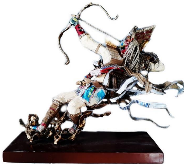
Gambar 4.21 Tari Baris Panah, Tampak Samping Kiri