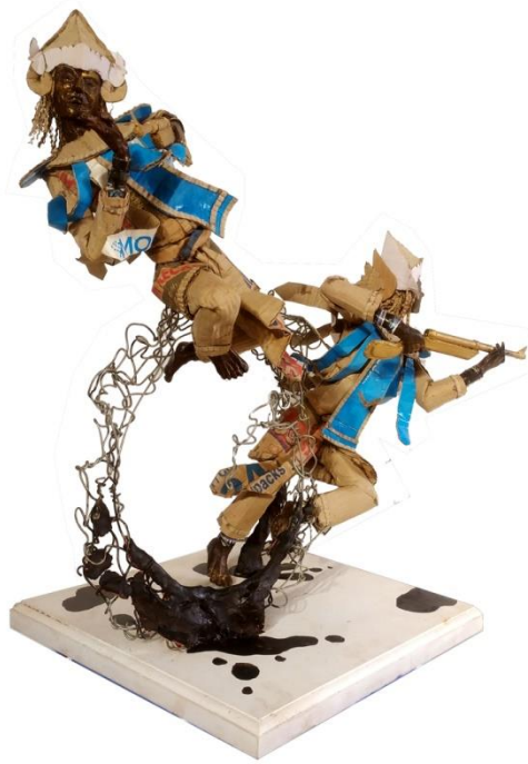
Gambar 4.29 Tari Baris Bedil, Tampak Samping Kanan.