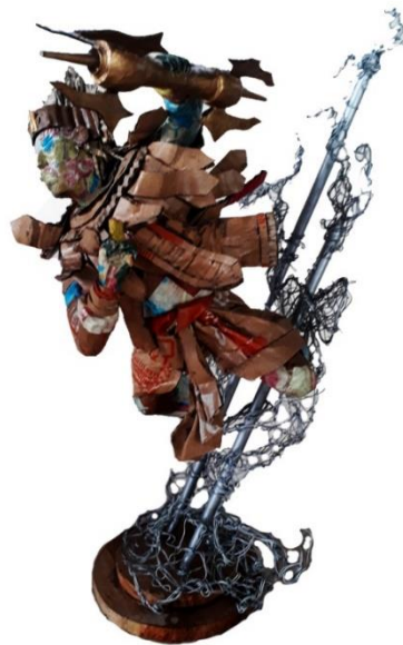
Gambar 4.24 Tari Baris Bajra, Tampak Samping Kiri.