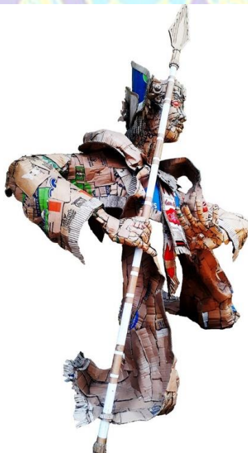
Gambar 4.35 Tari Baris Katekok Jago, Tampak Samping Kanan.