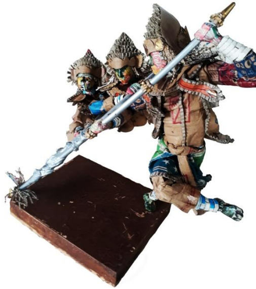
Gambar 4.31 Tari Baris Tumbak, Tampak Samping.