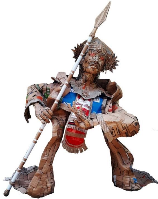
Gambar 4.34 Tari Baris Katekok Jago, Tampak Depan.