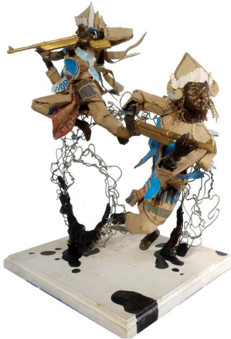
Gambar 4.30 Tari Baris Bedil, Tampak Samping Kiri.