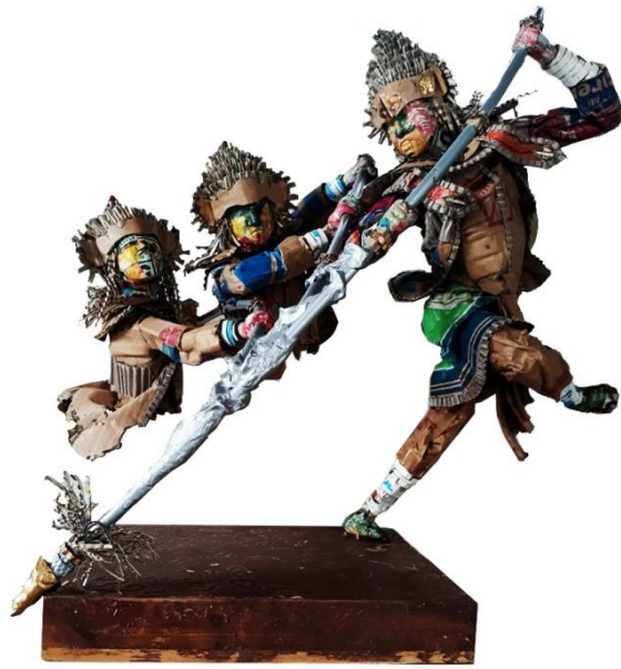
Gambar 4.33 Tari Baris Tumbak, Tampak Depan.