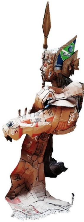
Gambar 4.36 Tari Baris Katekok Jago, Tampak Samping Kiri.