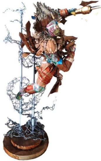
Gambar 4.23 Tari Baris Bajra, Tampak Samping Kanan.