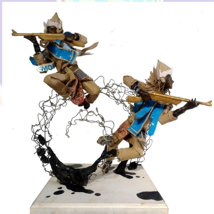
Gambar 4.28 Tari Baris Bedil, Tampak Depan.