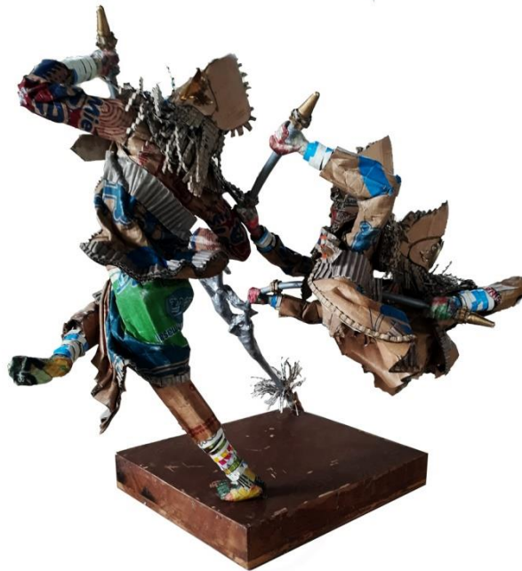
Gambar 4.32 Tari Baris Tumbak, Tampak Belakang.