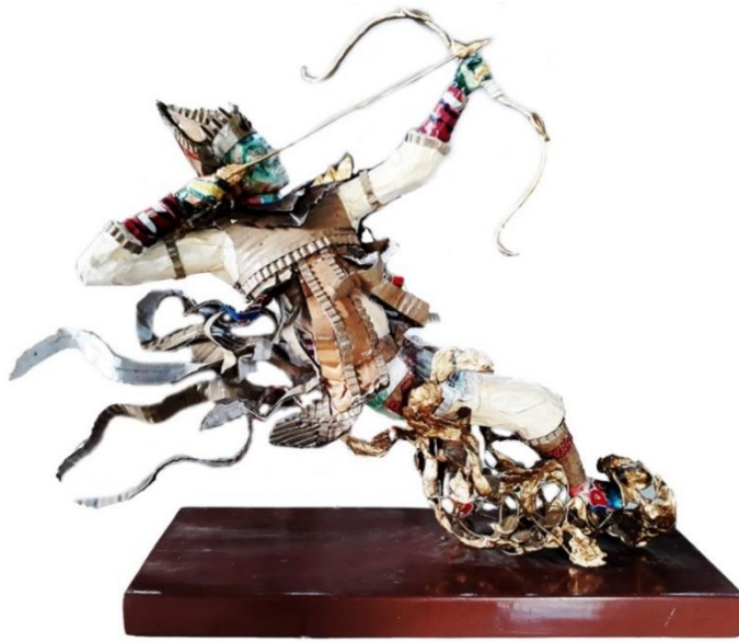
Gambar 4.20 Tari Baris Panah, Tampak Samping Kanan