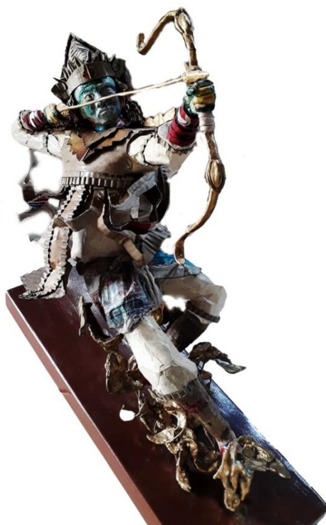
Gambar 4.22 Tari Baris Panah, Tampak Depan