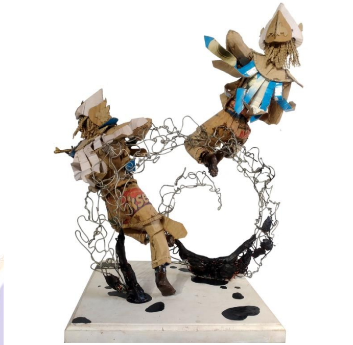
Gambar 4.27 Tari Baris Bedil, Tampak Belakang.