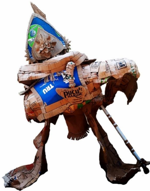
Gambar 4.37 Tari Baris Katekok Jago, Tampak Belakang.