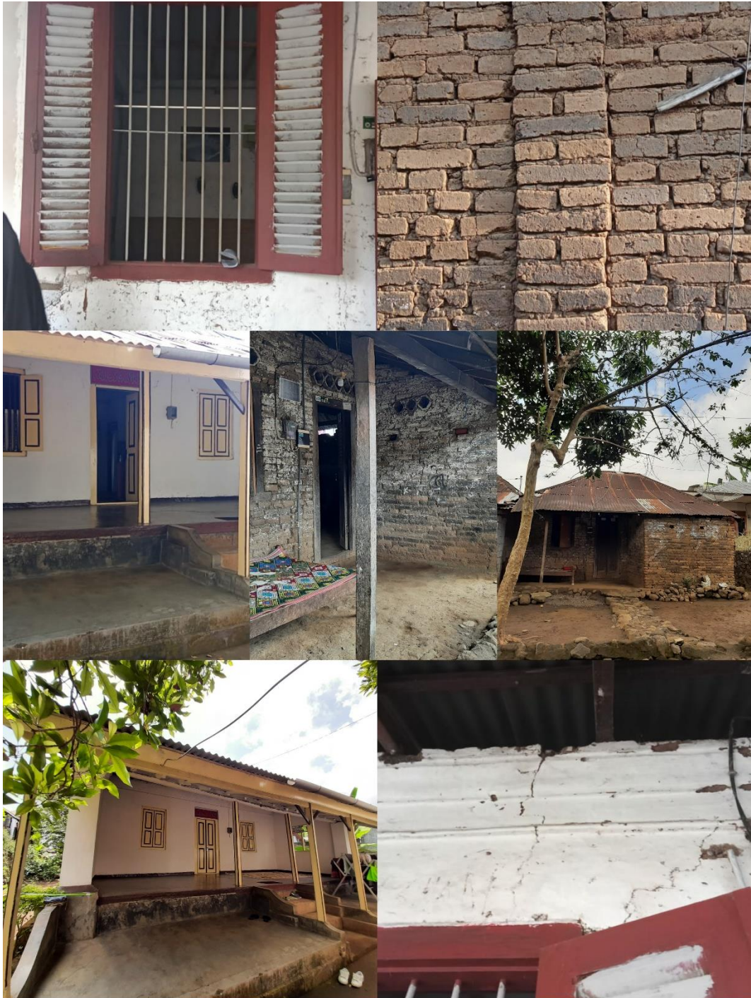
Dokumentasi saat melakukan wawancara sekaligus observasi pada rumah tradisional Desa Pegayaman