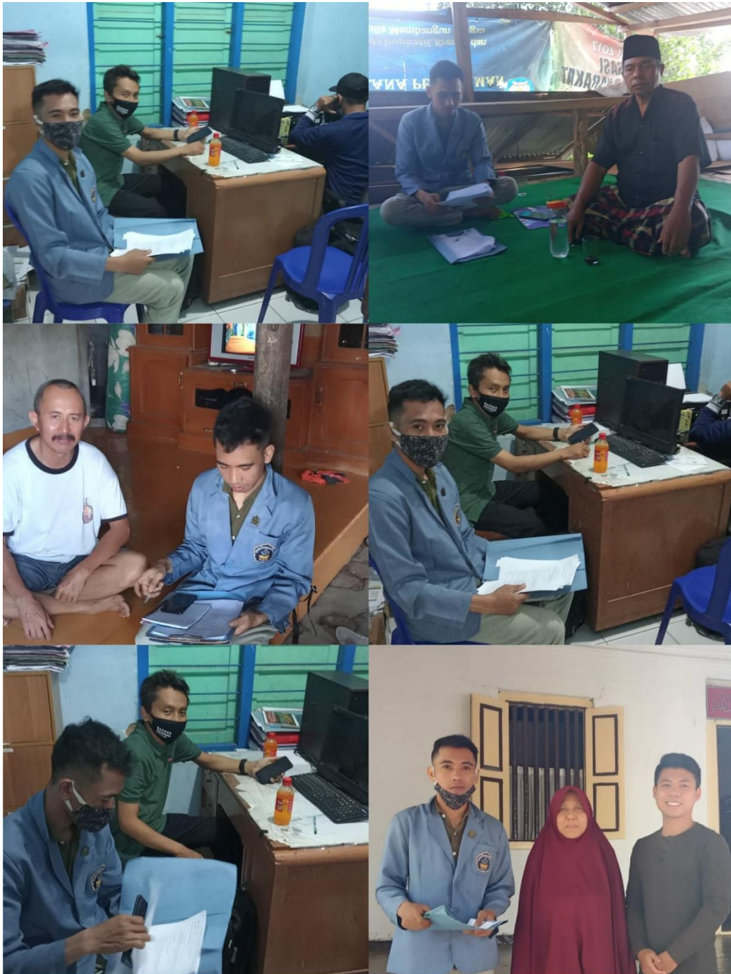
Dokumentasi pada saat wawanca sama masyarakat Desa Pegayaman