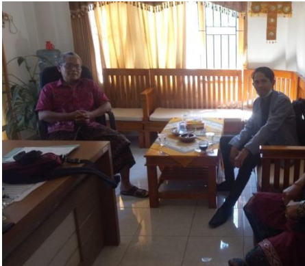
Gambar 1. Foto Bersama Perbekel Baktiseraga