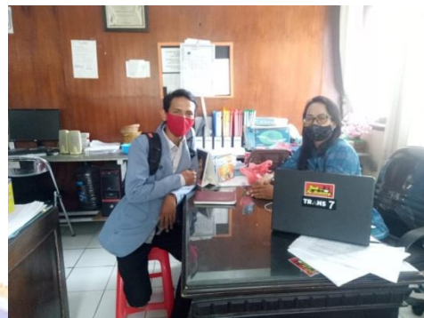
Gambar 2. Foto Bersama Bidang 4 Dinas Pariwisata Kabupaten Buleleng