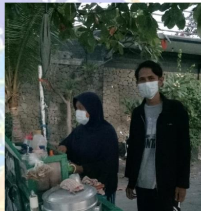
Gambar 4. Foto Bersama Pedagang di Pantai Indah