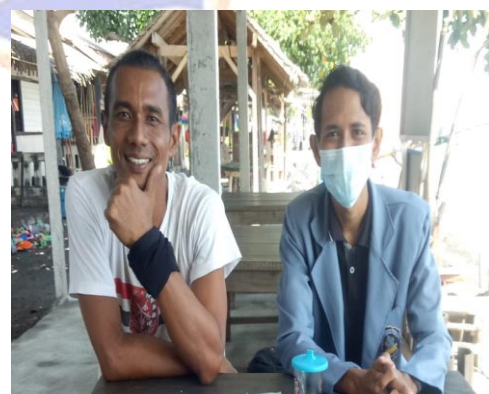
Gambar 5. Foto Bersama Nelayan di Pantai Indah