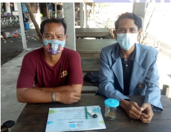
Gambar 5. Foto Bersama Ketua POKMASWAS Pantai Indah