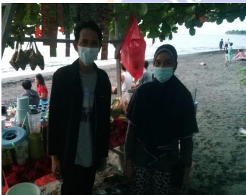
Gambar 3. Foto Bersama Pedagang di Pantai Indah