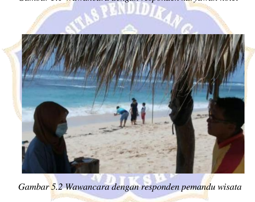
Gambar 5.2 Wawancara dengan responden pemandu wisata