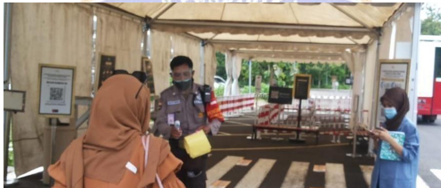
Gambar 5.5 Wawancara Responden Penjaga Keamanan