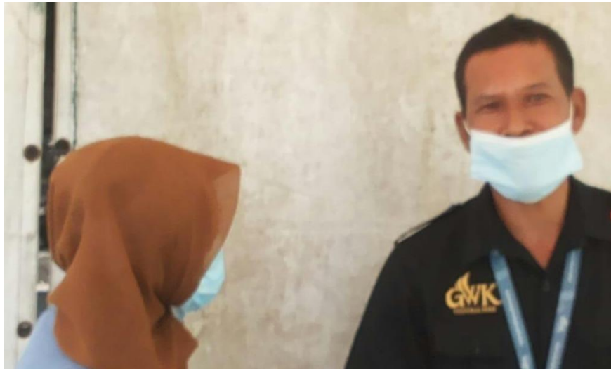
Gambar 5.4 Wawancara Responden Penjaga Keamanan