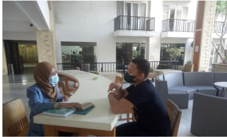
Gambar 5.1 Wawancara dengan responden karyawan hotel