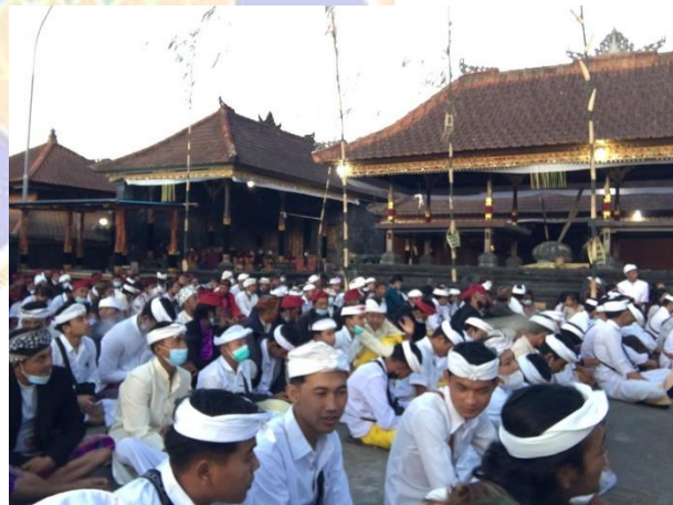
Picture 14 Conducting Prayer