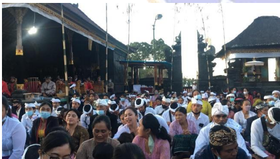
Picture 13 Conducting Prayer