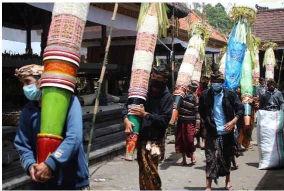
Picture 11. Nyurud Dangsil