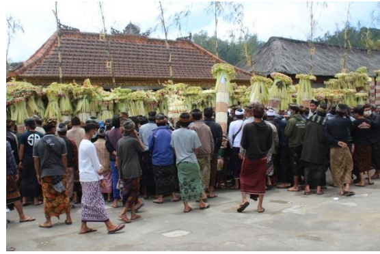
Picture 10. Nyurud Dangsil