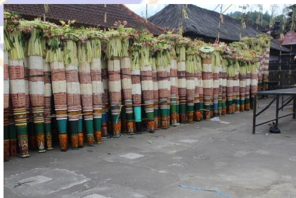
Picture 8. Dangsil Kraman Tuanan