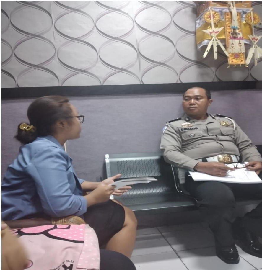
Foto wawancara dengan Penyidik di Unit Laka Lanta Polres Buleleng yang menangani kasus pelanggaran lalu lintas yang dilakukan oleh anak dan menyebabkan hilangnya nyawa orang lain di Kota Singaraja.