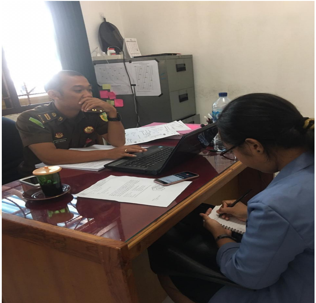
Foto wawancara dengan Kasubsi Pratut Tindak Pidana Umum Kejaksaan Negeri Buleleng yang menangani kasus pelanggaran lalu lintas yang dilakukan oleh anak di Kota Singaraja.