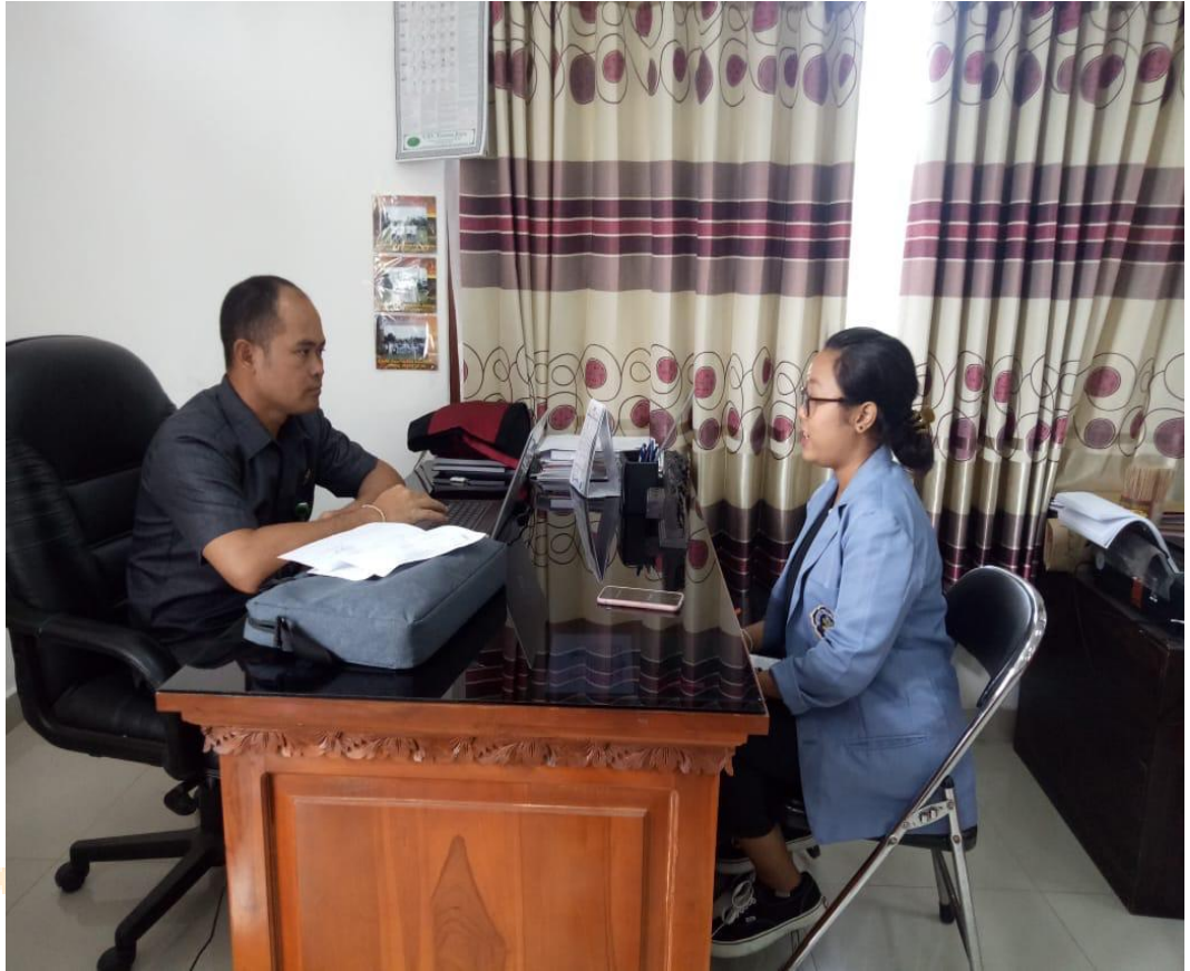
Foto wawancara dengan Hakim khusus anak kasus pelanggaran lalu lintas yang dilakukan oleh anak di Kota Singaraja.