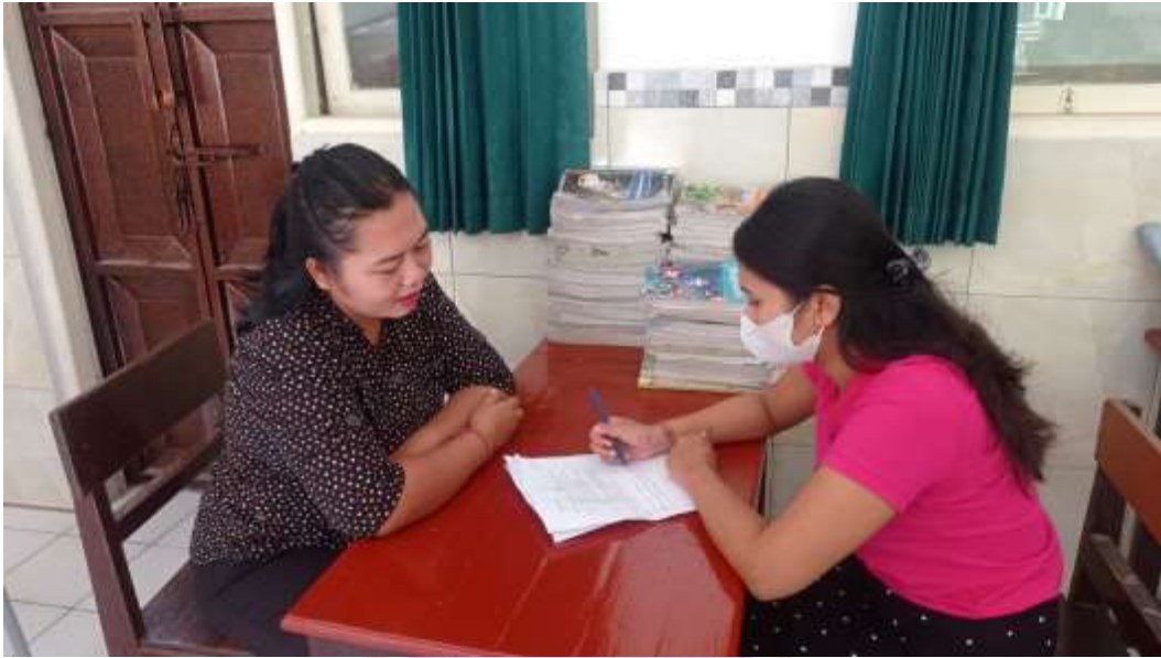
Kegiatan wawancara dengan pegawai perpustakaan bidang layanan referensi di Perpustakaan SMP Negeri 6 Singaraja