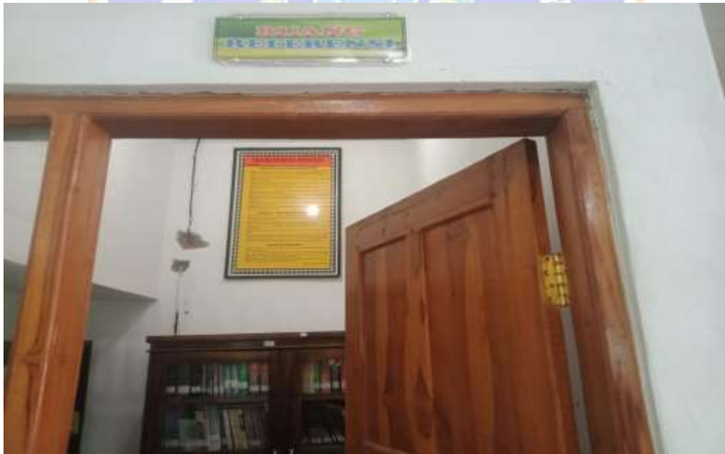
Gambar Layanan Refrensi Perpustakaan SMP Negeri 6 Singaraja