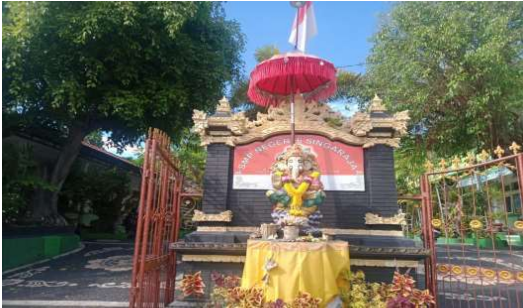
Gambar Sekolah SMP Negeri 6 Singaraja