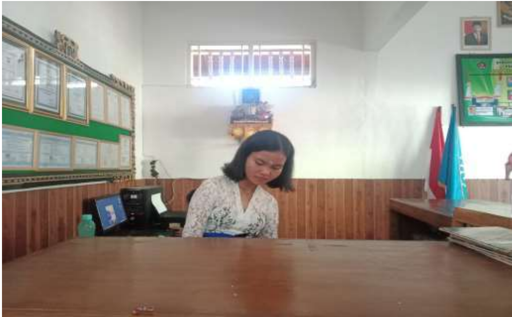
Gambar Ruang Layanan Sirkulasi Perpustakaan SMP Negeri 6 Singaraja