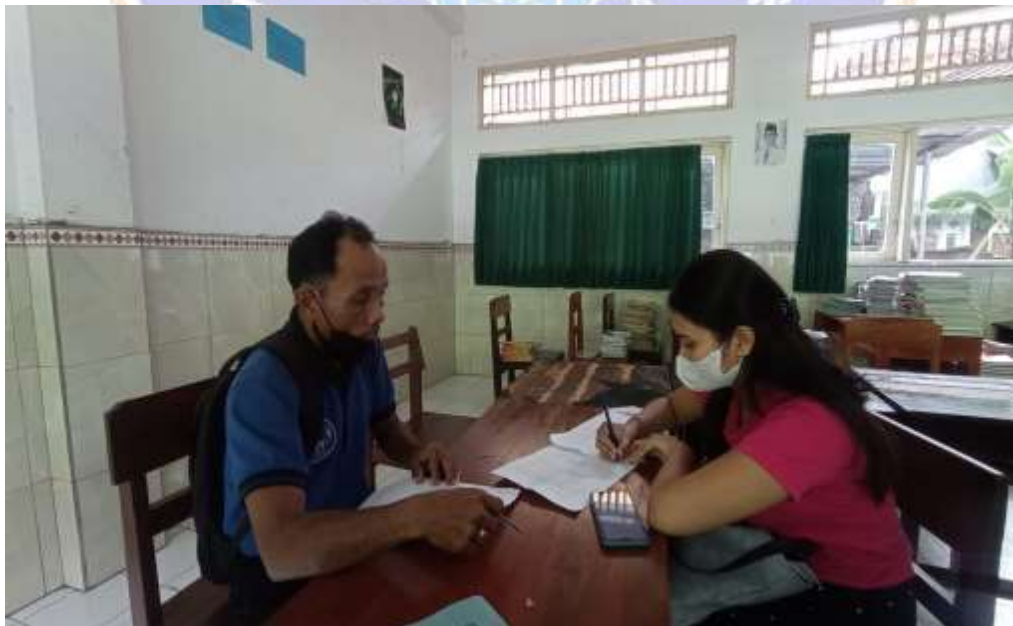
Kegiatan wawancara dengan pegawai perpustakaan bidang layanan teknis di Perpustakaan SMP Negei 6 Singaraja