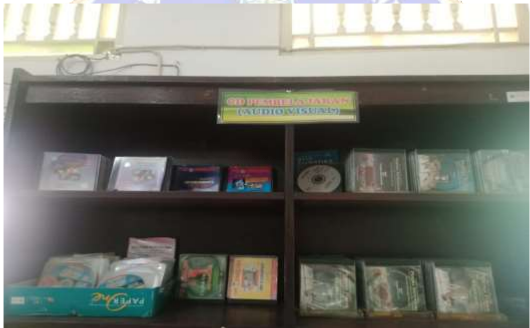
Gambar Layanan Koleksi Audiovisual