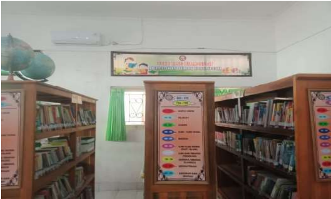
Gambar Layanan Koleksi Umum Perpustakaan SMP Negeri 6 Singaraja