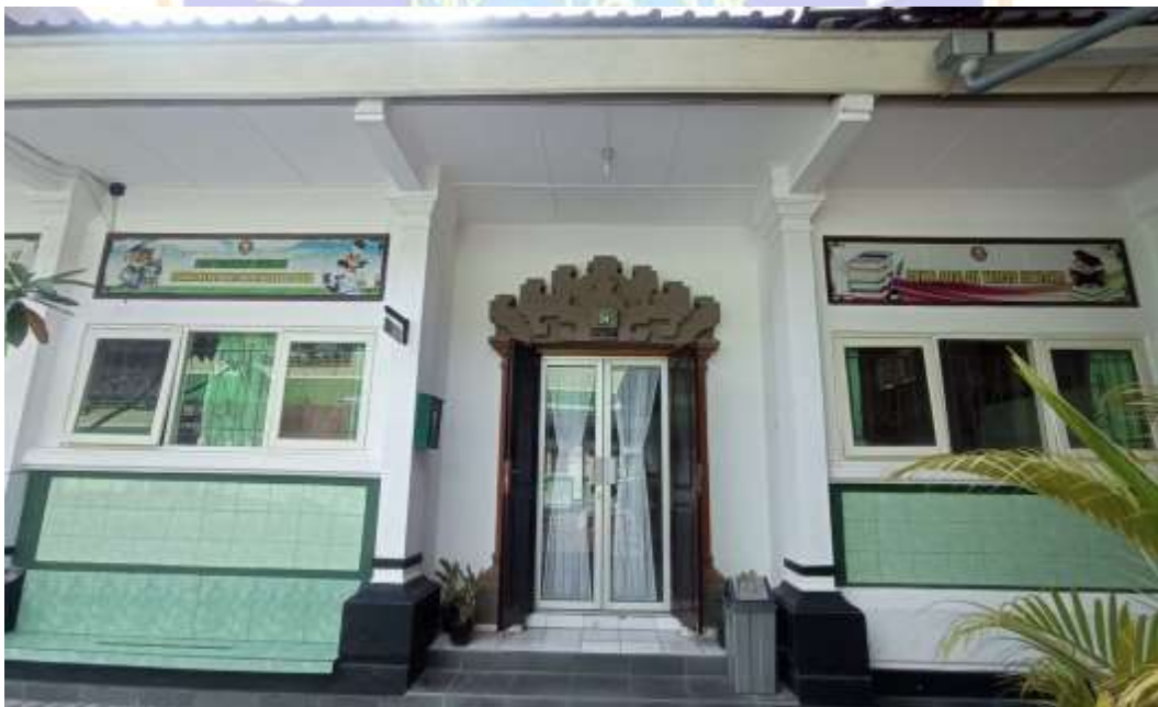
Gedung Perpustakaan SMP Negeri 6 Singaraja