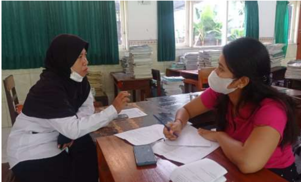
Kegiatan Wawancara dengan Ibu Kepala Perpustakaan SMP Negeri 6 Singaraja