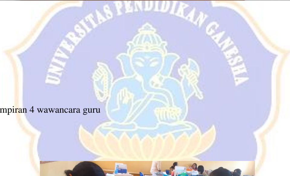
Lampiran 4 wawancara guru