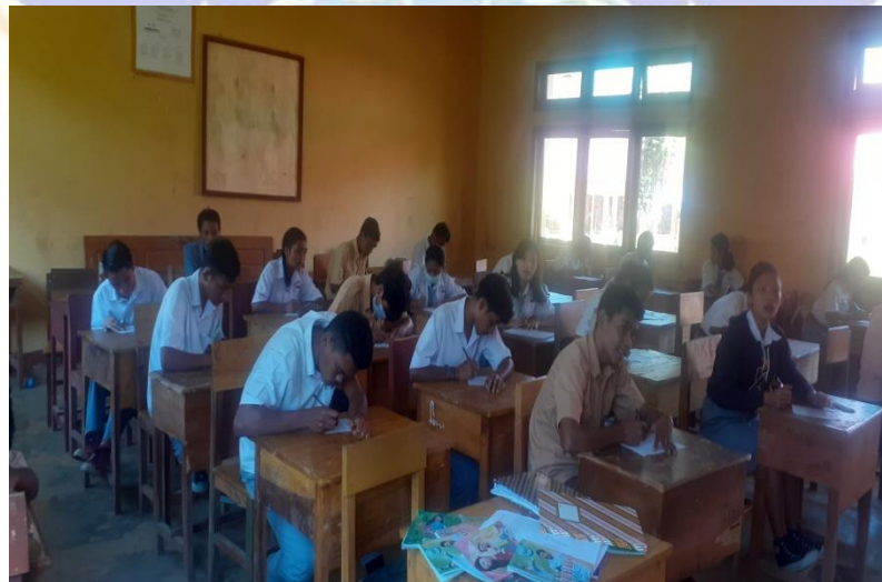
Lampiran 6 Membimbing Siswa Dalam Kerja Kelompok