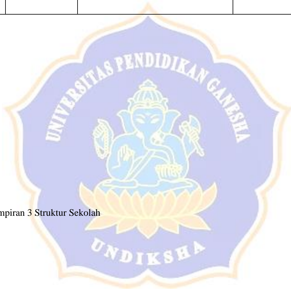
Lampiran 3 Struktur Sekolah