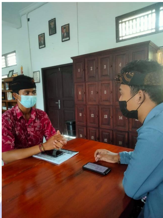
Kegiatan Wawancara terhadap siswa di SMAN 2 Negara