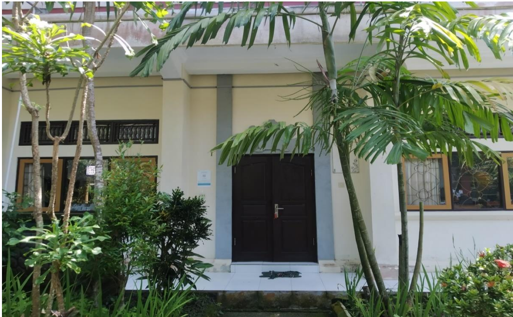
Gambar Depan Perpustakaan SMAN 2 Negara