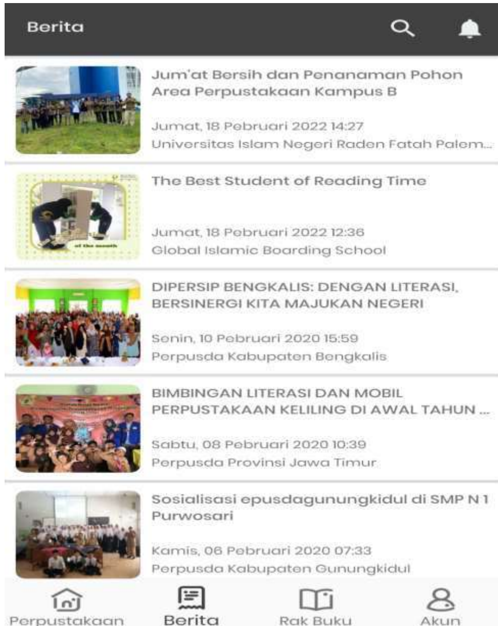
Tampilan Informasi yang ada di aplikasi iJembrana