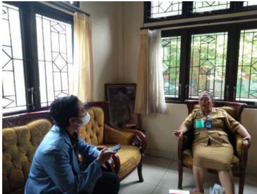
Kegiatan wawancara dengan Ibu Kepala Dinas Perpustakaan dan Kearsipan Kabupaten Jemberana