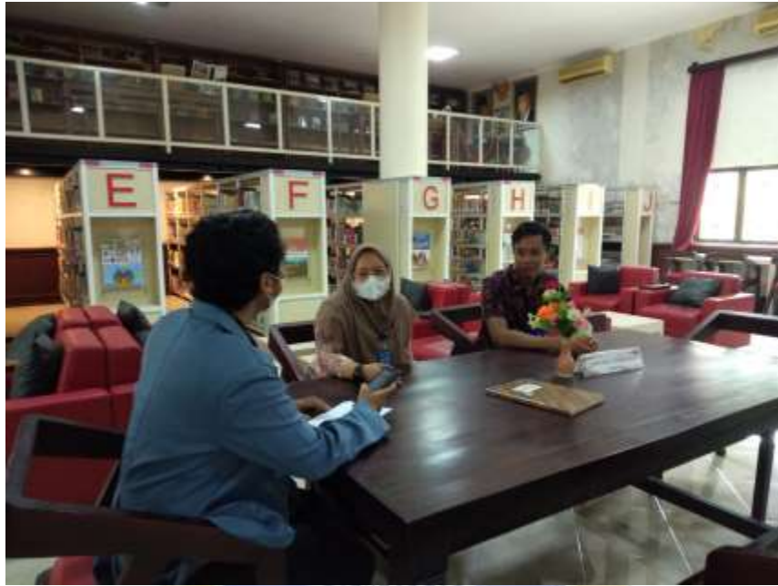
Kegiatan wawancara dengan pustakawan Dinas Perpustakaan dan Kearsipan Kabupaten Jembrana