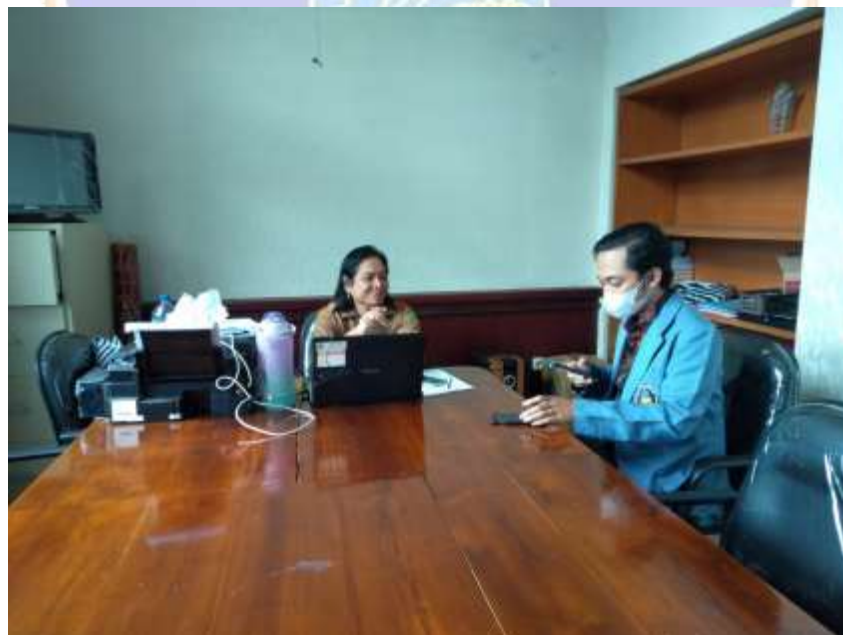
Kegiatan wawancara dengan Pustakawan bidang pengembangan dan pengolahan bahan pustaka Dinas Perpustakaan dan Kearsipan Kabupaten Jemberana