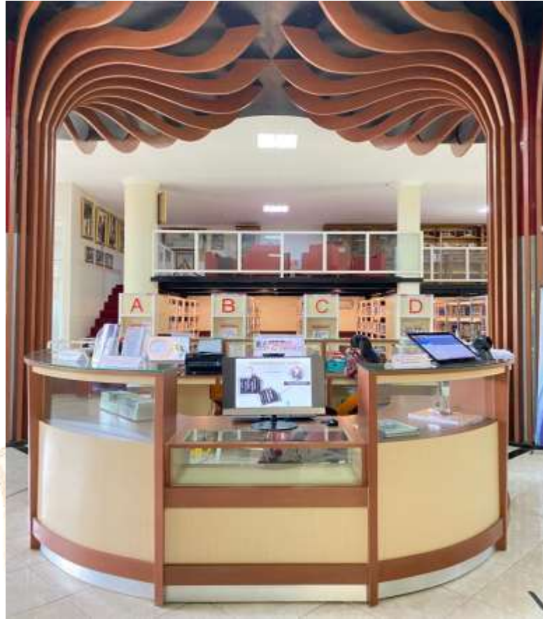
Gedung Dinas Perpustakaan dan Kearsipan Kabupaten Jember