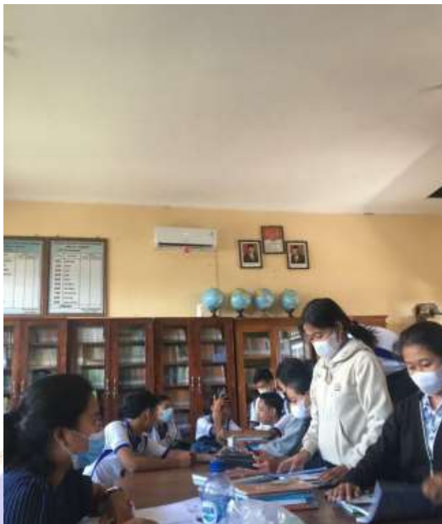
Ruang Baca Perpustakaan SMK Negeri 1 Seririt (Sumber : Dokumen Pribadi Ayu Indah, Mei 2022)