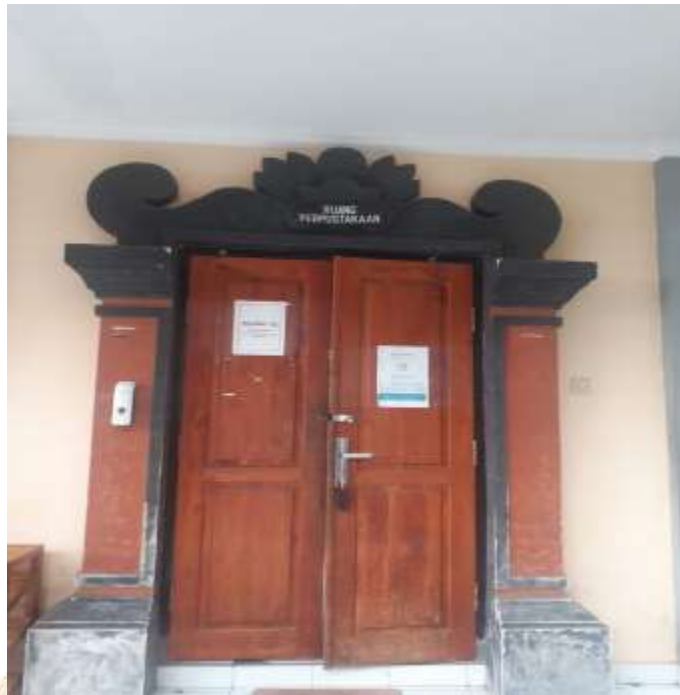
Perpustakaan SMK Negeri 1 Seririt