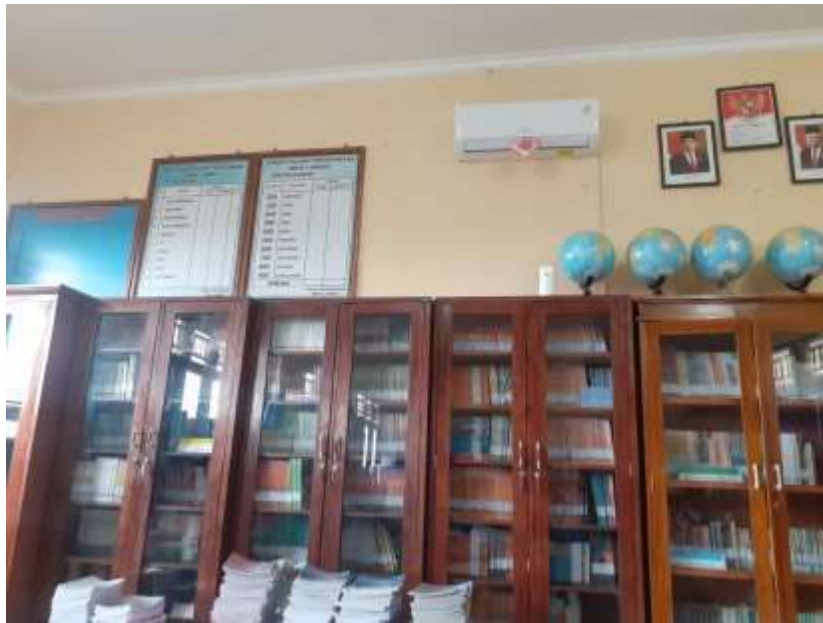
Koleksi Umum Perpustakaan SMK Negeri 1 Seririt