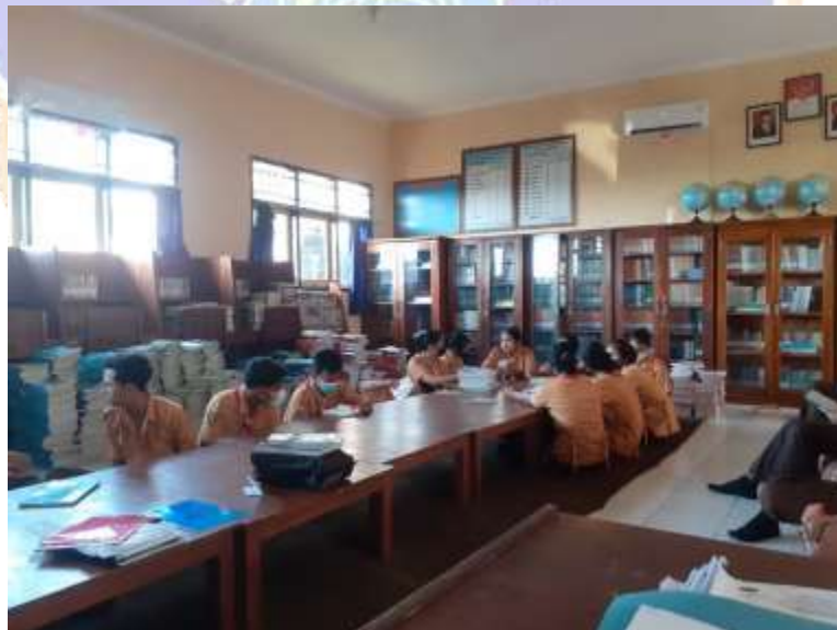
Kondisi Perpustakaan SMK Negeri 1 Seririt