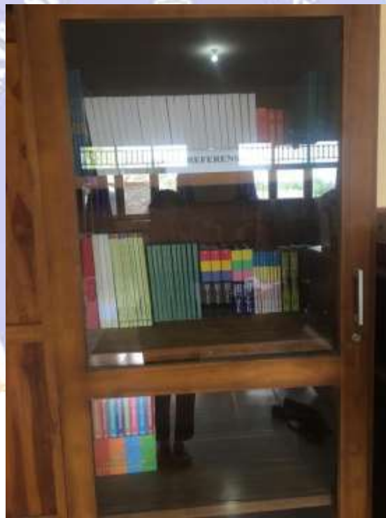
Koleksi Refrensi Perpustakaan SMK Negeri 1 Seririt (Sumber : Dokumentasi Pribadi Ayu Indah, Mei 2022)