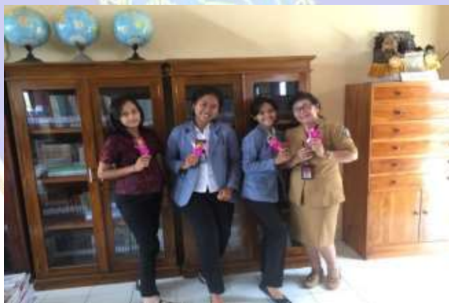
Foto Bersama Kepala Perpustakaan serta Pegawai Perpustakaan