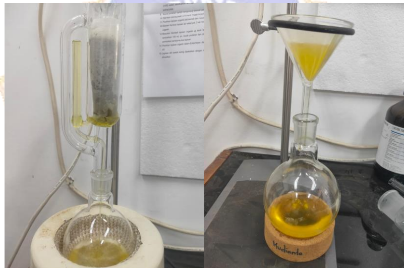
Lampiran D. Soxhletasi