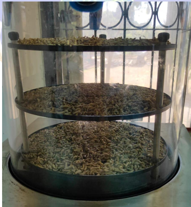
Lampiran B. Freeze Drying