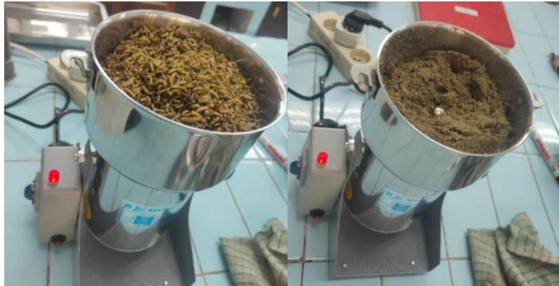
Lampiran C. Penggerusan