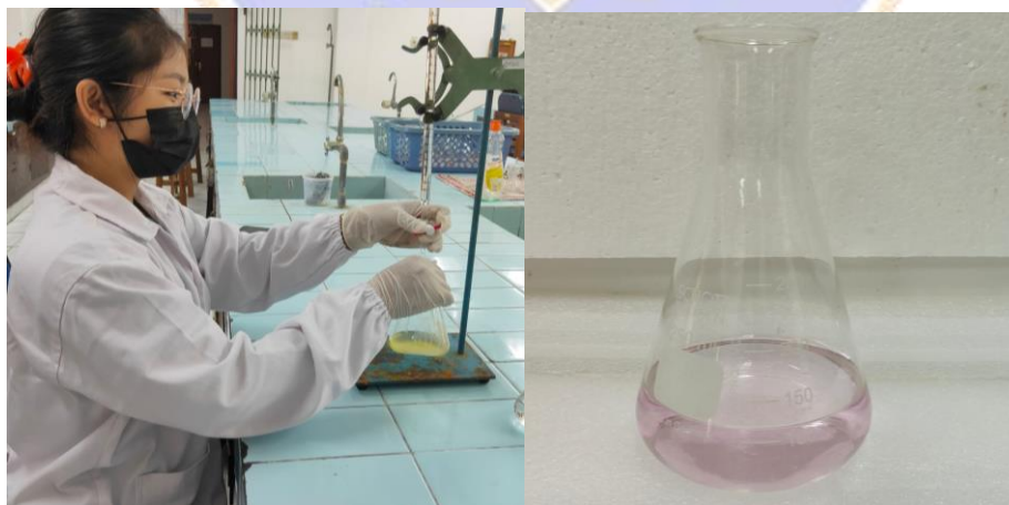
Lampiran K. Uji Bilangan Asam