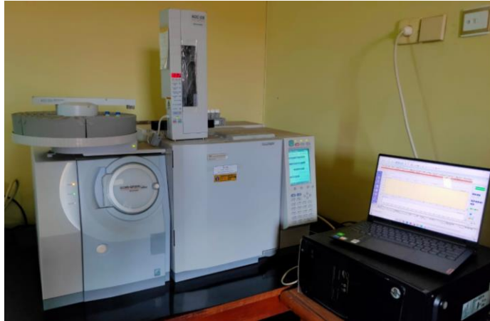
Lampiran F. Instrumen GC-MS