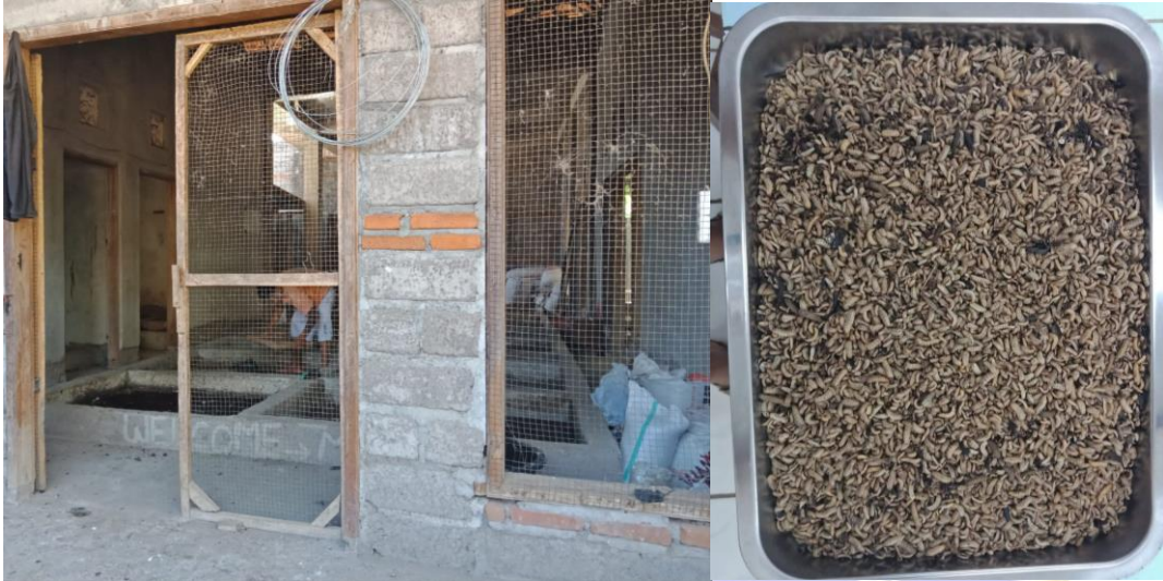
Lampiran A. Pengambilan sampel Maggot