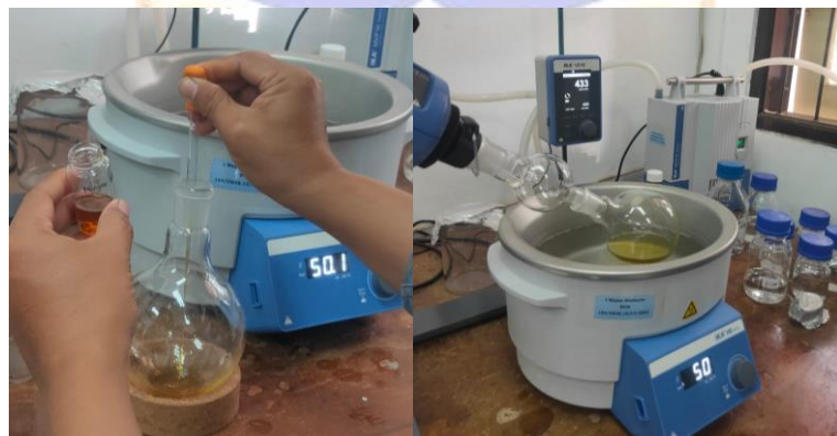
Lampiran E. Evaporasi