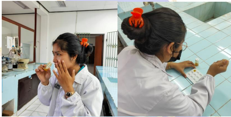
Lampiran G. Uji Bau dan Uji Warna