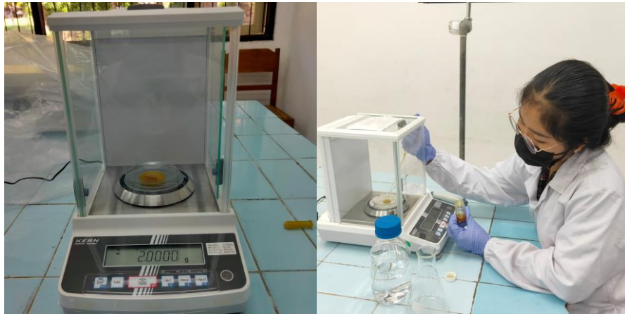
Lampiran I. Menimbang 2 gram sampel