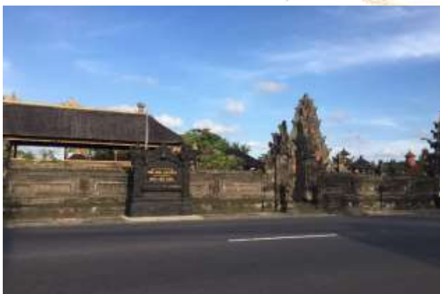
Pura Desa lan Puseh Desa Kapal