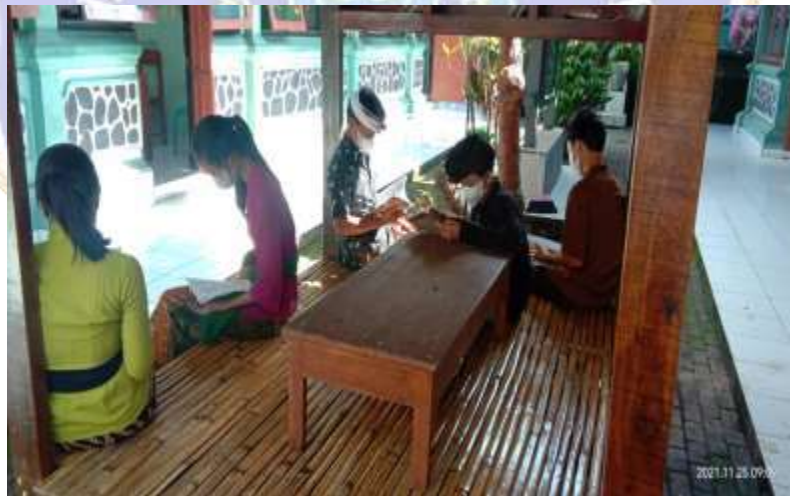
Gambar 6 Kegiatan Literasi di saung baca (Sumber : Dokumentasi Pribadi Nur Azizah 2022)