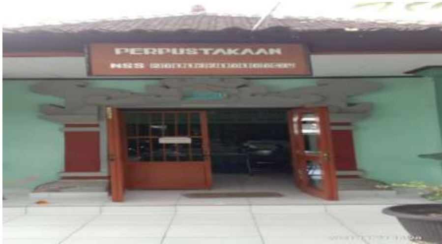
Gambar 1 Tampak depan Perpustakaan SMP Negeri 4 Singaraja