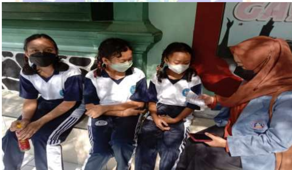
Gambar 12 Wawancara kepada siswa SMP Negeri 4 Singaraja (Sumber: Dokumentasi Pribadi Nur Azizah)