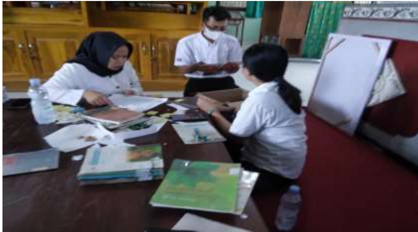
Gambar 7 Pengadaan Koleksi buku