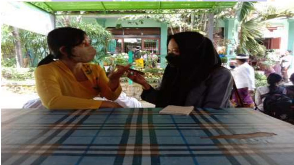
Gambar 10 Wawancara kepada guru SMP Negeri 4 Singaraja