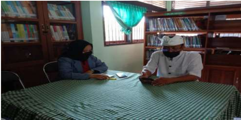
Gambar 9 Wawancara kepada kepala perpustakaan SMP Negeri 4 Singaraja