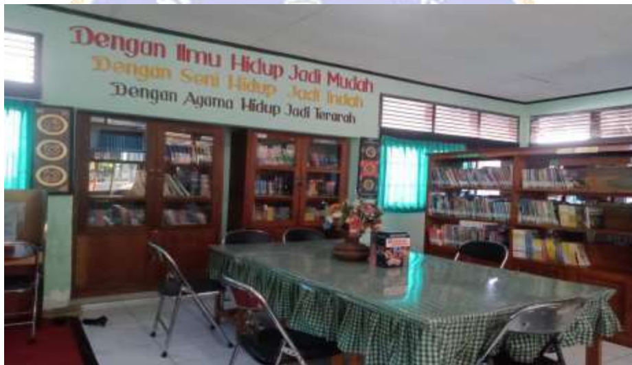
Gambar 2 Ruangan Perpustakaan SMP Negeri 4 Singaraja