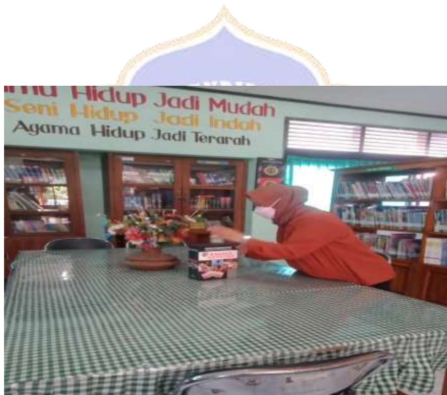
Gambar 4 Kegiatan menata ruang perpustakaan