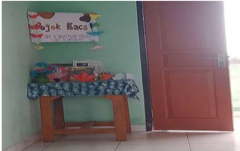
Gambar 5 Pojok baca di ruang kelas