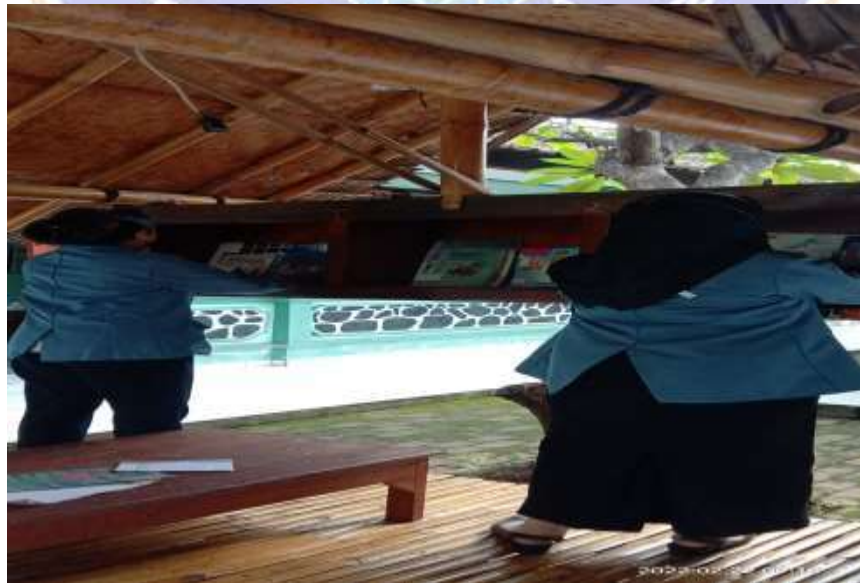
Gambar 8 Menata koleksi buku di pojok baca