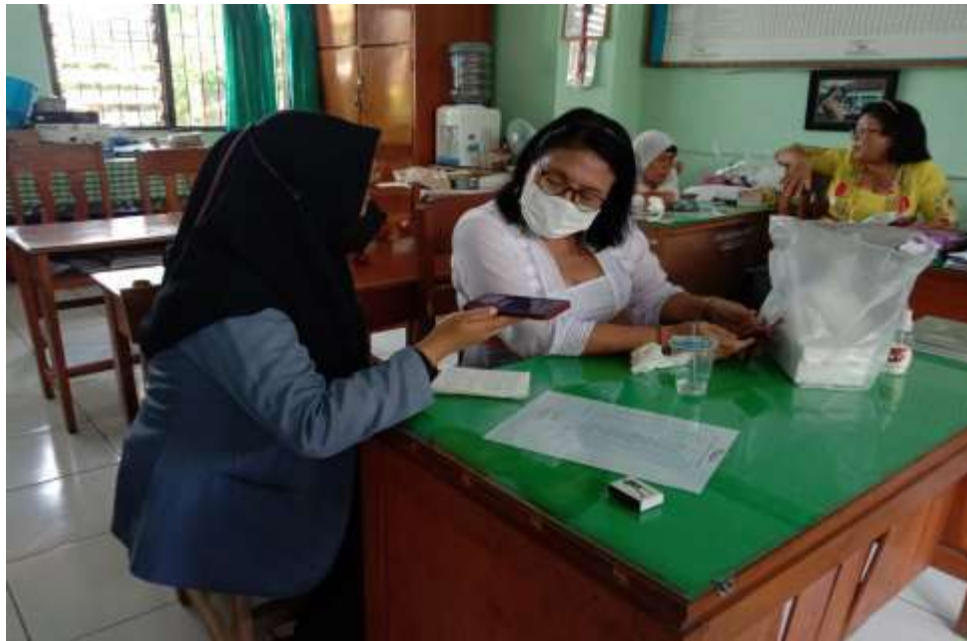
Gambar 11 Wawancara kepada guru SMP Negeri 4 Singaraja