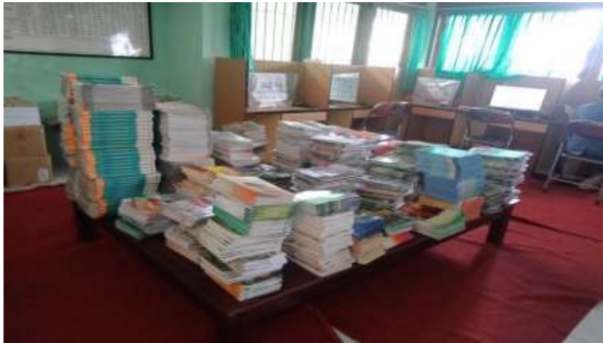
Gambar 3 Kegiatan mengumpulkan judul buku yang sama