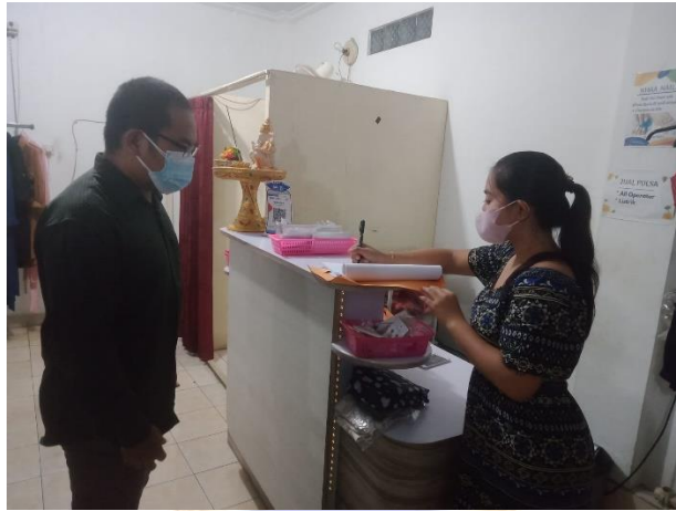
Foto Penyebaran Kuesioner Penelitian