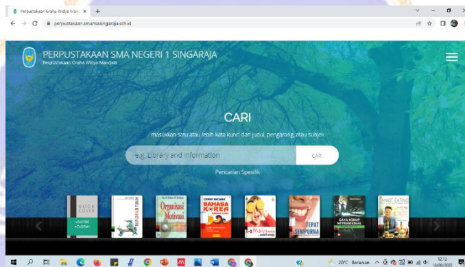
Gambar 6 Tampilan OPAC