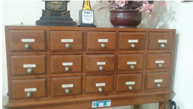
Gambar 5 Lemari Katalog