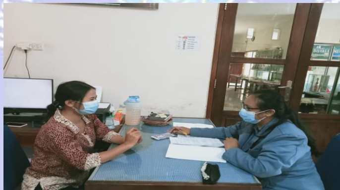
Gambar 2 Kegiatan Wawancara dengan Pustakawan Perpustakaan Graha Widya Mandala SMA Negeri 1 Singaraja