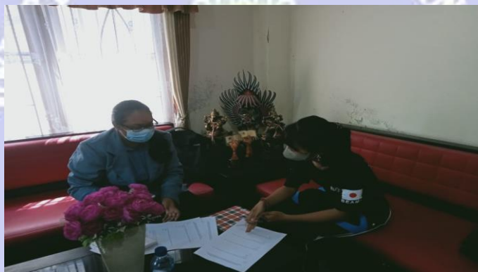
Gambar 4 Kegiatan Wawancara dengan Pengguna Perpustakaan Graha Widya Mandala SMA Negeri 1 Singaraja