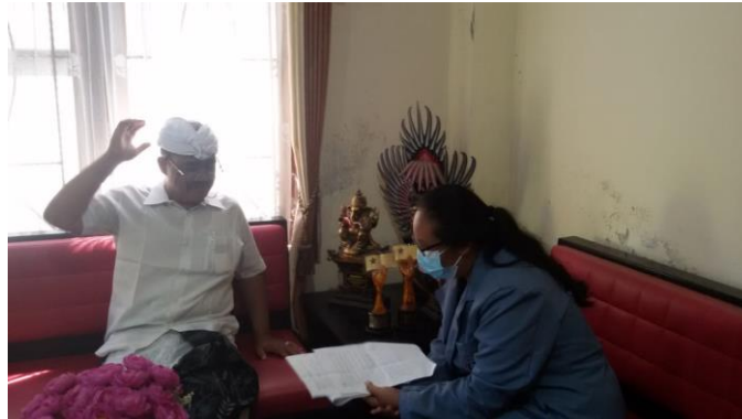
Gambar 1 Kegiatan Wawancara dengan Kepala Perpustakaan Graha Widya Mandala SMA Negeri 1 Singaraja