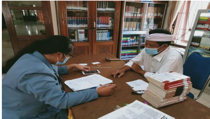
Gambar 3 Kegiatan Wawancara dengan Tenaga Perpustakaan Graha Widya Mandala SMA Negeri 1 Singaraja