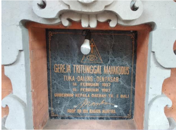
Gambar 1. Monumen Peresmian Gereja Tritunggal Maha Kudus - Tuka