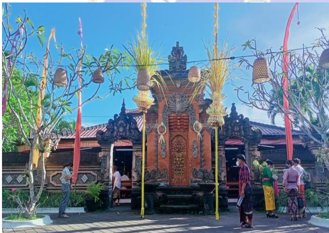
Gambar 2. Gapura Gereja bermuansa Bali