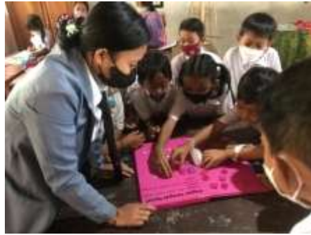
Penyebaran Angket Respon Siswa