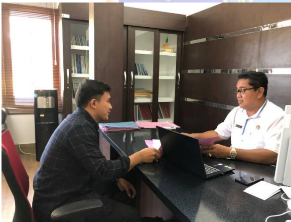
Gambar 03. Uji Validitas