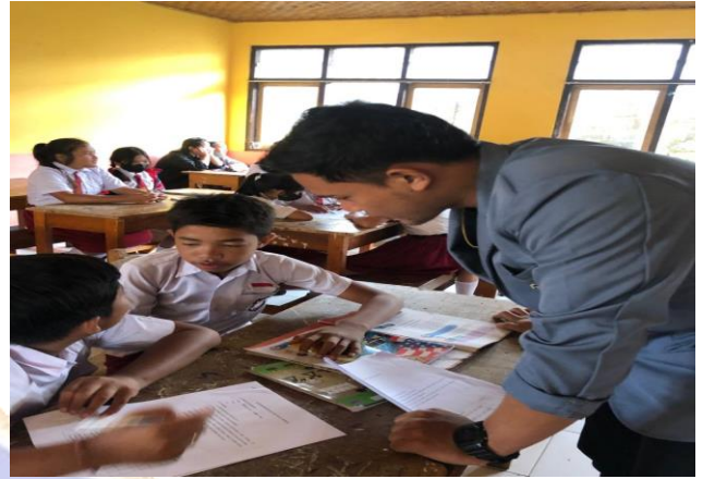
Gambar 01. Uji Coba Instrumen SDN 1 Songan