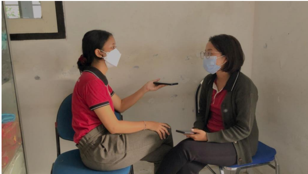
Gambar 1. Wawancara dengan Mahasiswa Pendidikan Kesejahteraan Keluarga