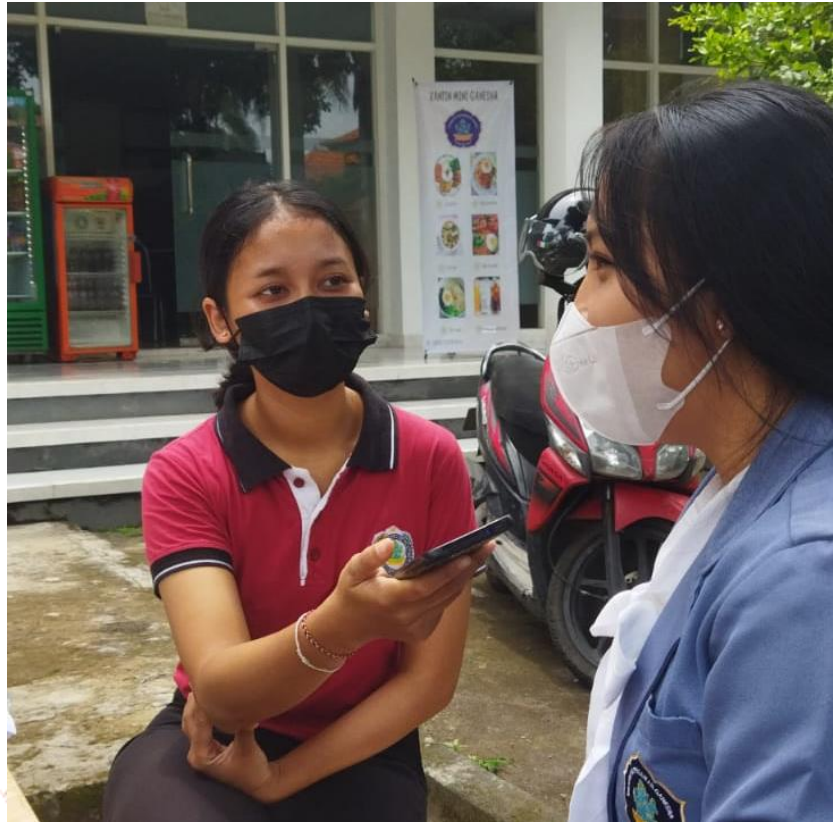
Gambar 3. Wawancara dengan Mahasiswa Pendidikan Kesejahteraan Keluarga