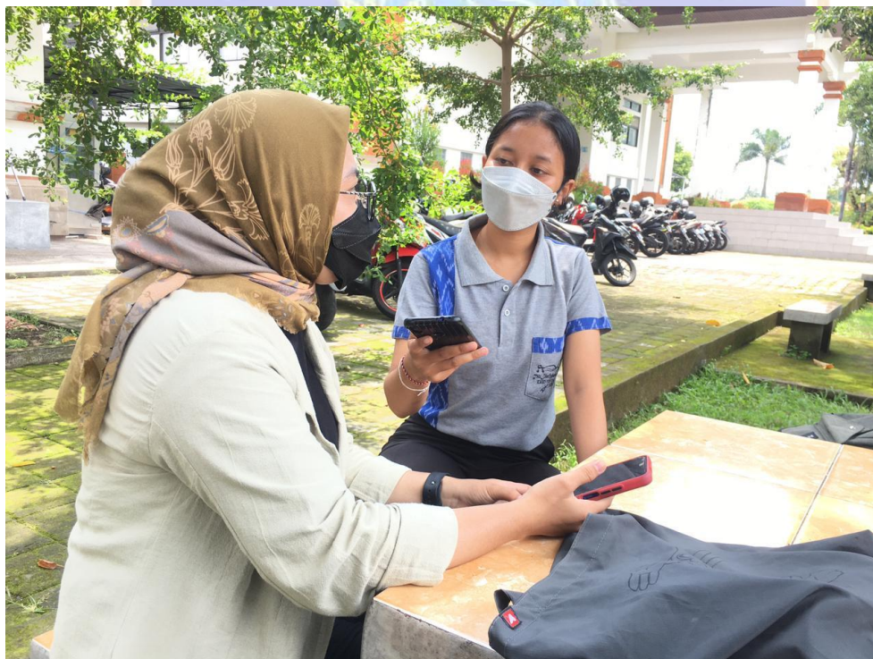
Gambar 4. Wawancara dengan Mahasiswa Pendidikan Kesejahteraan Keluarga