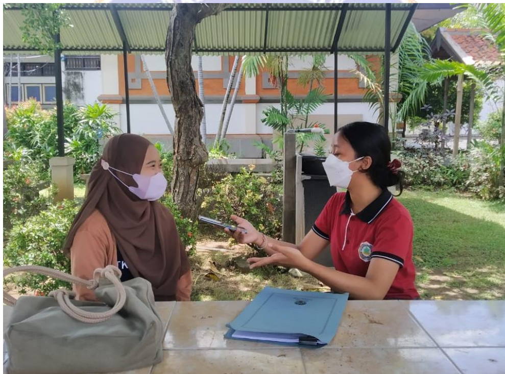
Gambar 2. Wawancara dengan Mahasiswa Pendidikan Kesejahteraan Keluarga