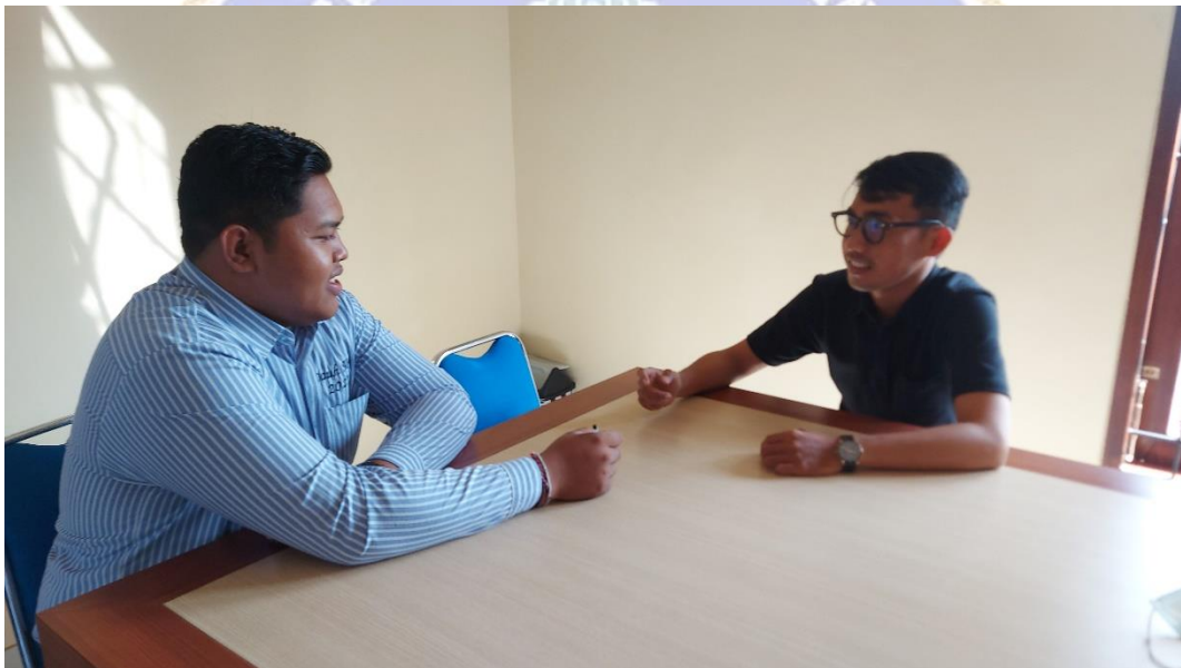
Kegiatan Wawancara dengan Karyawan Bagian Umum