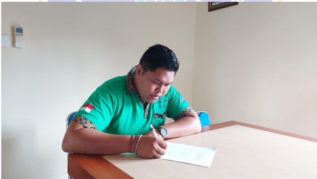
Pengisian Kuesioner Karyawan Bagian Umum