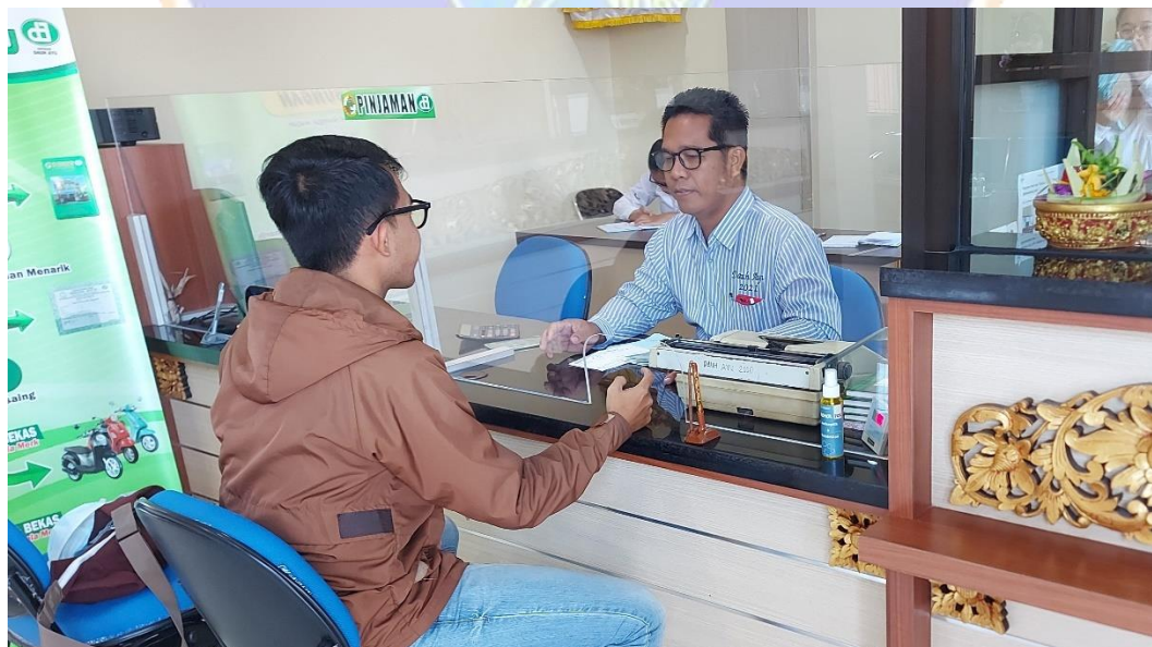
Proses Penyerahan Kuesior Kepada Karyawan