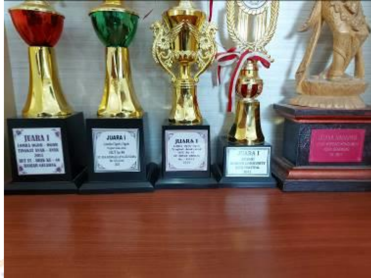
Lampiran 1. Penghargaan dan Prestasi dari Koperasi Dauh Ayu