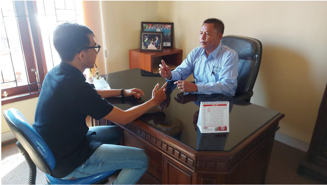
Kegiatan Wawancara dengan Manajer