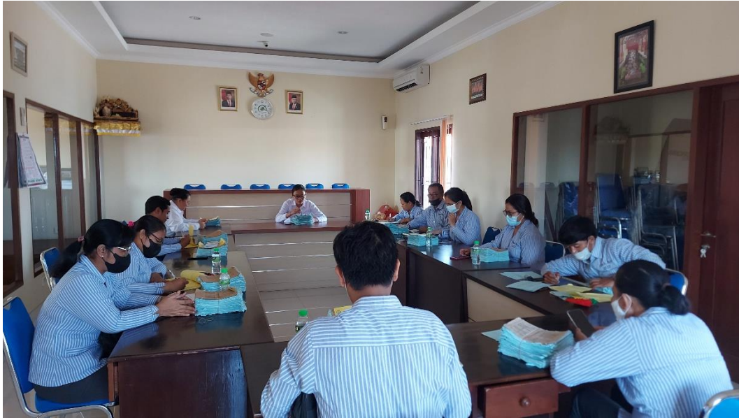
Kegiatan Input Manual Data Simpanan