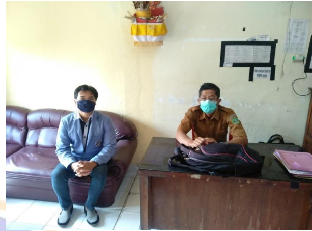
Wawancara dengan pokja bidang perlindungan (Sentanu, 2021)