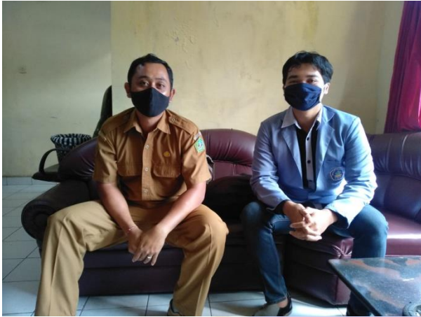
Wawancara dengan pokja bidang pelestarian lingkungan (Sentanu, 2021)