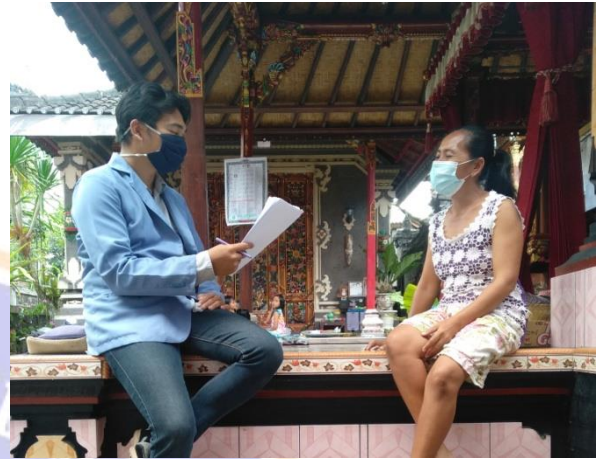
Wawancara dengan warga Dusun Rejasa Kelod (Sentanu, 2021)