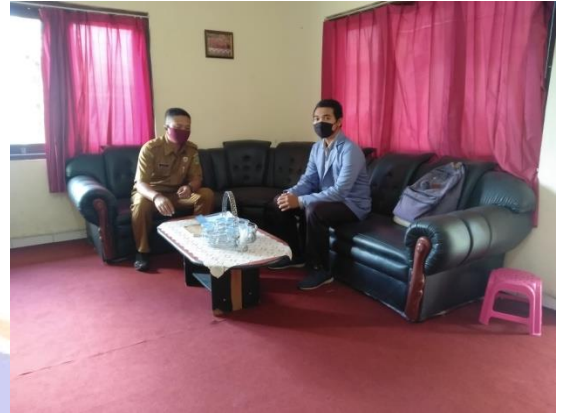
Wawancara dengan Kepala Desa (Sentanu, 2021)