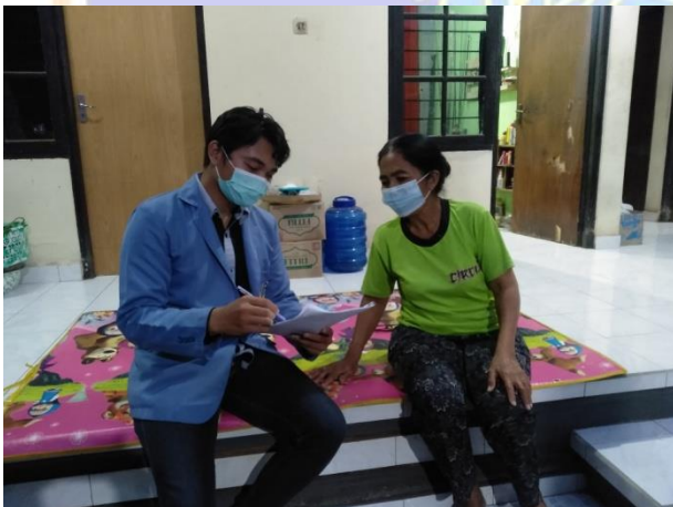
Wawancara dengan warga Dusun Kelembang (Sentanu, 2021)