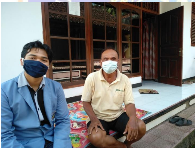
Wawancara dengan pokja bidang agama (Sentanu, 2021)