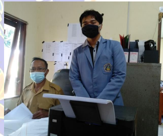
Wawancara dengan pokja bidang cinta dan kasih sayang (Sentanu, 2021)