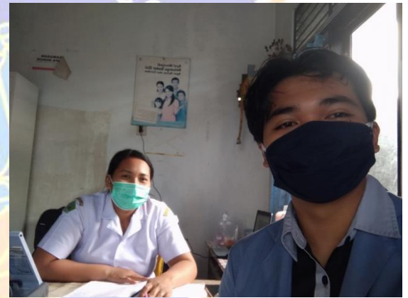
Wawancara dengan pokja bidang reproduksi