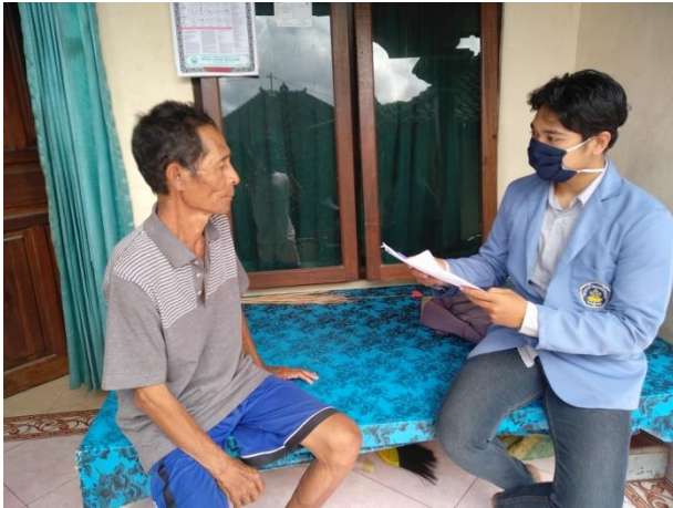
Wawancara dengan warga Dusun Rejasa Kaja (Sentanu, 2021)