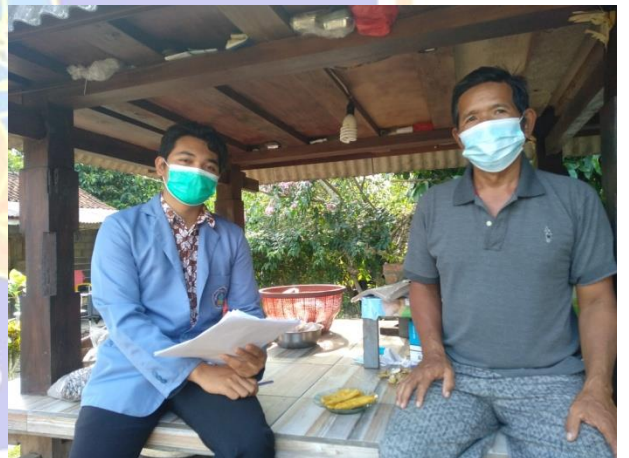
Wawancara dengan warga Dusun Pacut (Sentanu, 2021)