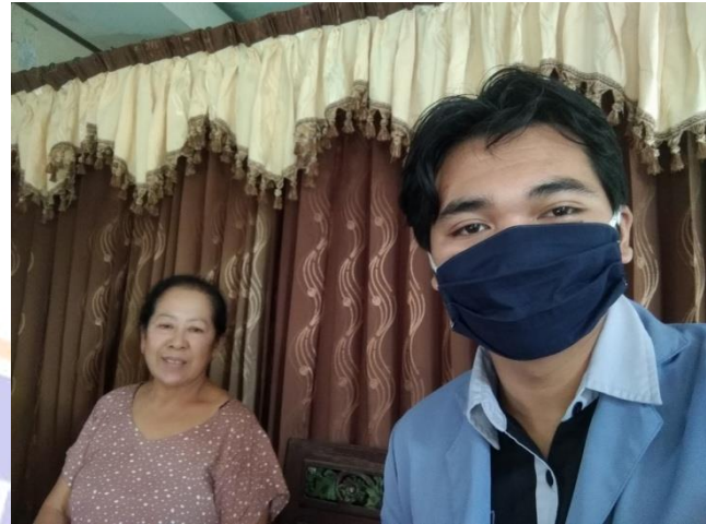
Wawancara dengan pokja bidang sosialisasi dan pendidikan (Sentanu, 2021)