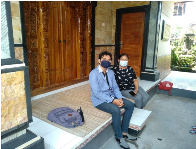
Wawancara dengan pokja bidang ekonomi (Sentanu, 2021)