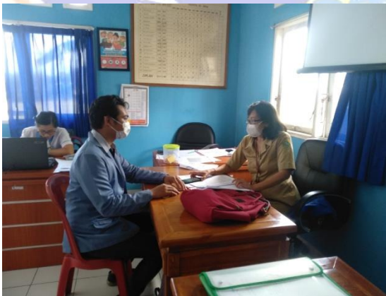
Wawancara dengan petugas KB Desa Rejasa (Sentanu, 2021)