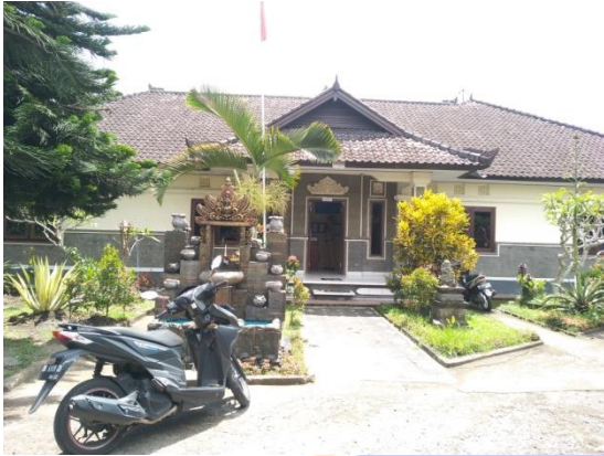
Kantor Desa, Desa Rejasa (Sentanu, 2021)