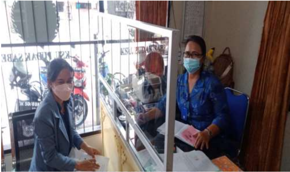
(Wawancara bersama Wakil Ketua KSU Pudak Sabe)