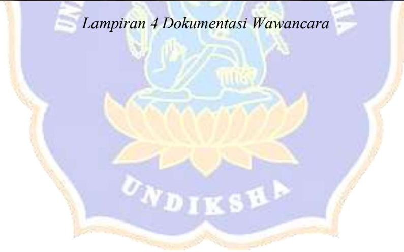
Lampiran 4 Dokumentasi Wawancara