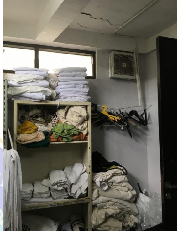
Gambar 2 Panrty Linen Villa