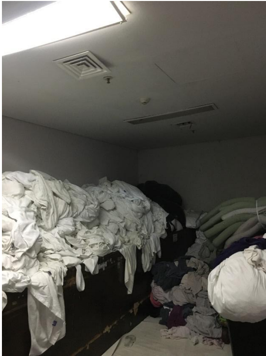
Gambar 5 Linen Soil Storage