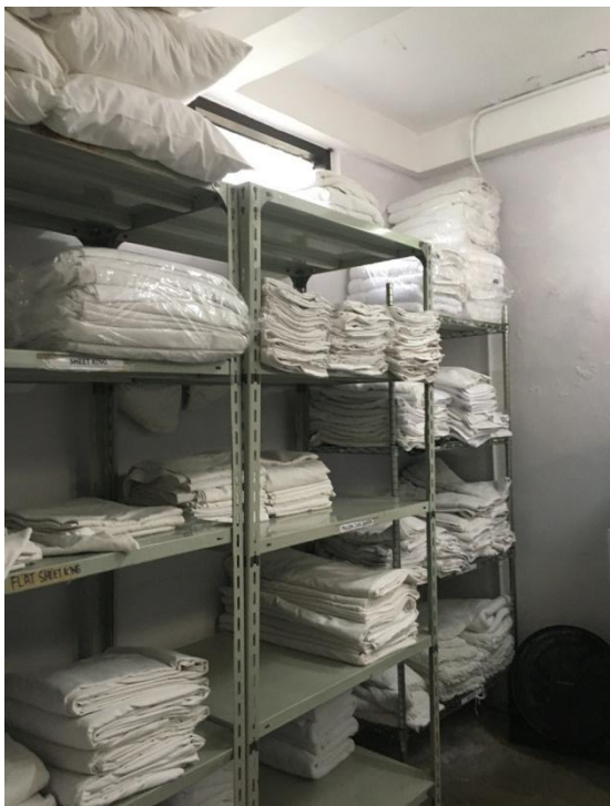
Gambar 7 Pantry Linen Escape