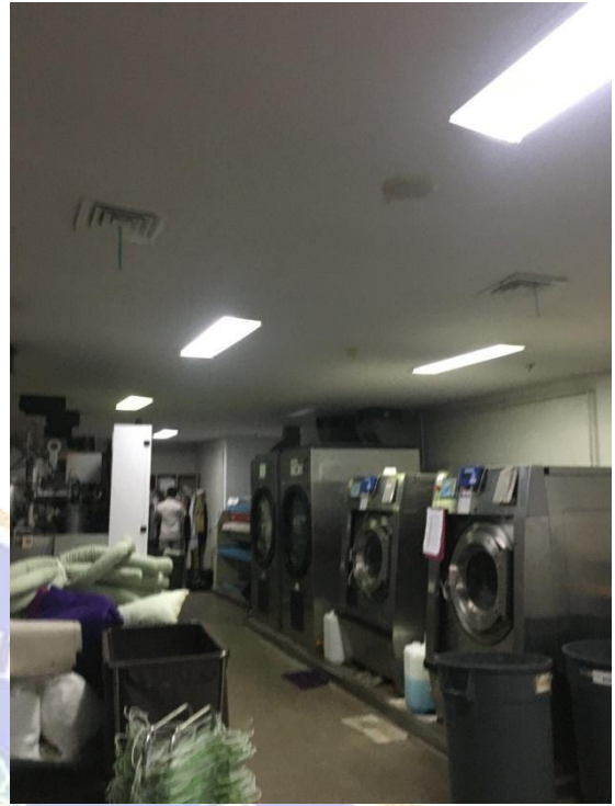
Gambar 6 Laundry