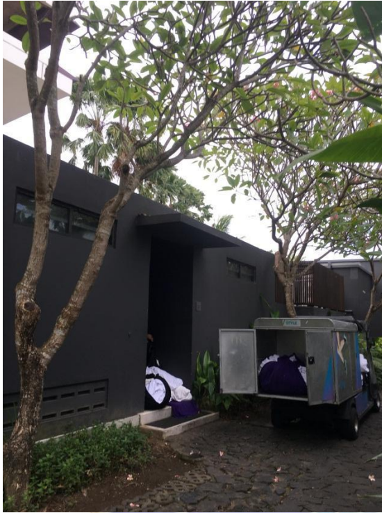
Gambar. 1 Proses Pendistribusian Linen