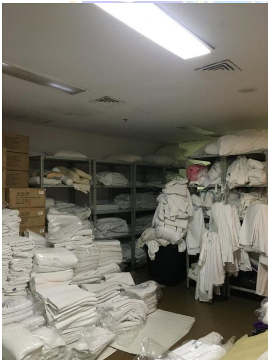
Gambar 3 Linen Storage