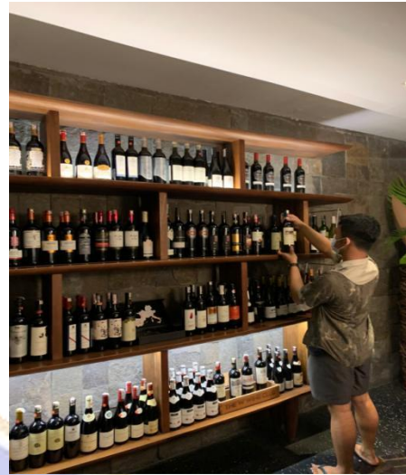
2. Gambar Wine Cellar