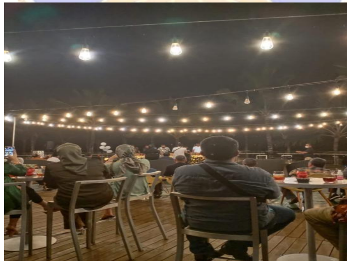
5. Gambar Dinner 100 pax