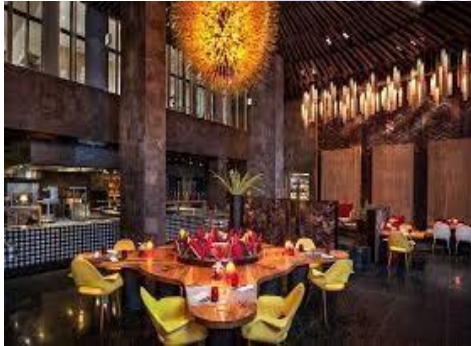
3. Gambar Fire Restaurant