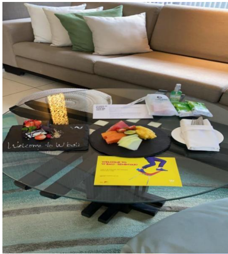
1. Gambar Set Up Amenities