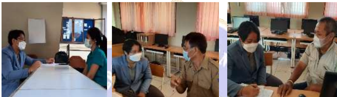
Wawancara guru matematika