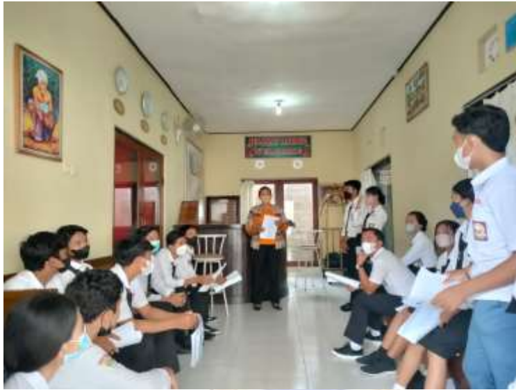
Siswa melaksanakan praktek menangani reservasi individu