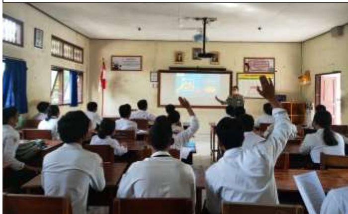
Siswa mulai aktif dalam kegiatan penayangan video saat pembelajaran berlangsung berkaitan dengan menangani reservasi individu