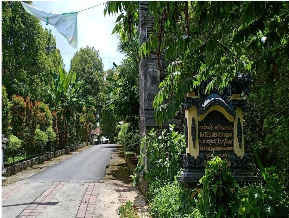
(Suasana Desa Adat cempaga)