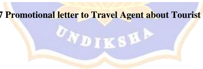
Picture 7 Promotional letter to Travel Agent about Tourist Attraction