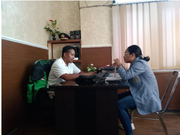
Foto wawancara bersama Kepala Unit I Pidana Umum