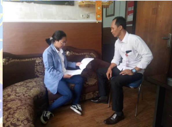
Foto wawancara bersama penyidik di Unit I Pidana umum