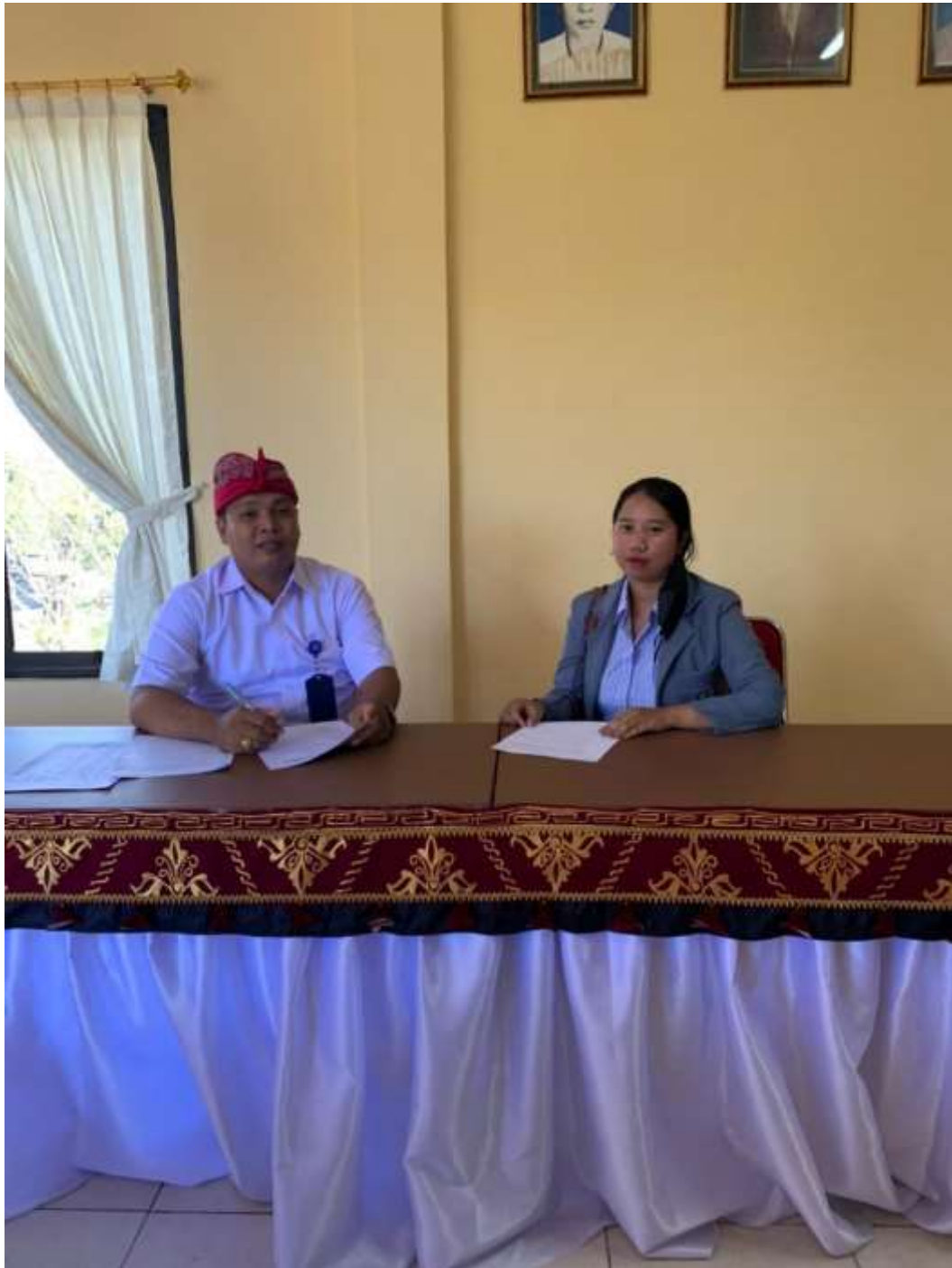
Lampiran 4. Wawancara Di PD. BPR Bank 45 Singaraja