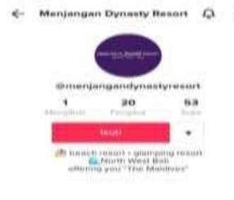
Pemasaran Langsung ( Direct Marketing )