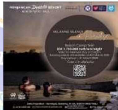
Promosi Penjualan ( Sales Promotion )