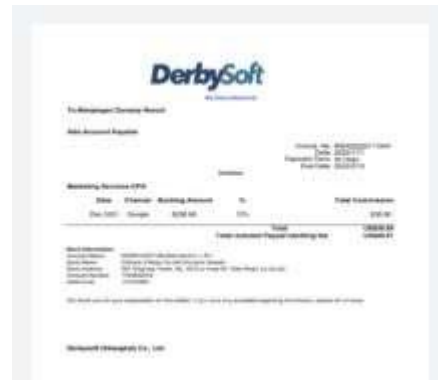
Periklanan ( Advertising )