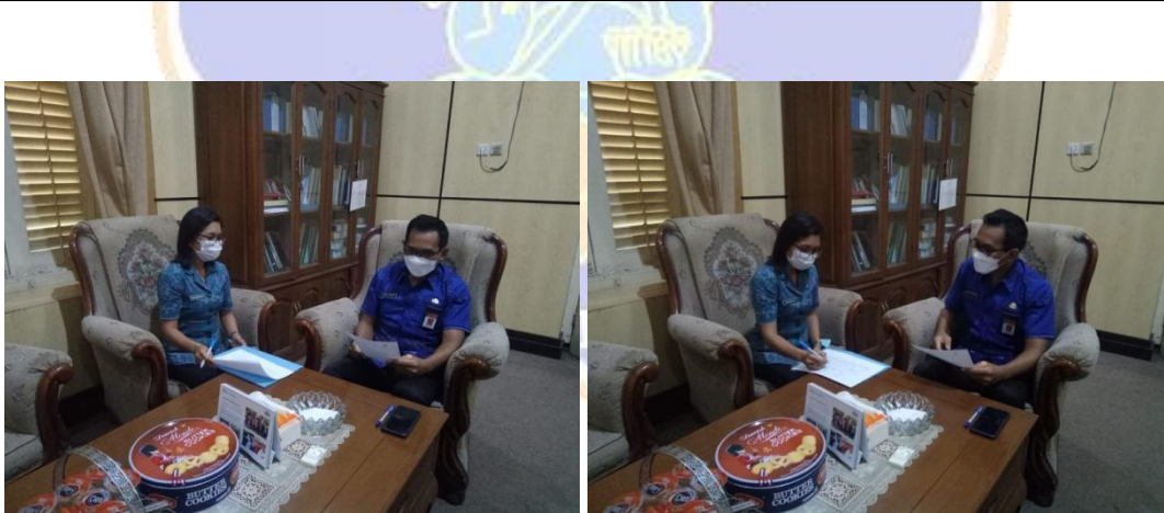
Wawancara dengan Sekretaris Bappeda Kabupaten Buleleng-31 Mei 2022