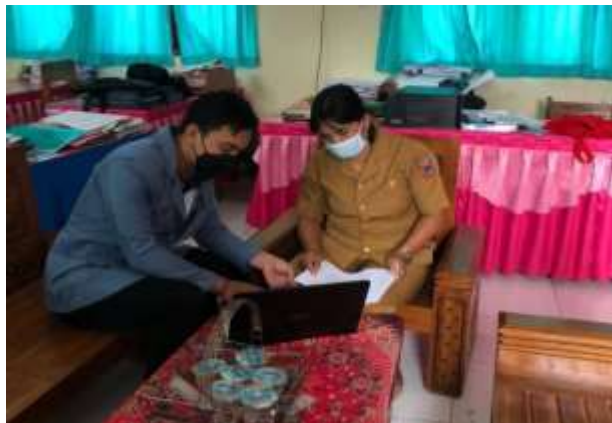
Gambar 01. Ovservasi media pembelajaran kepada wali kelas IV