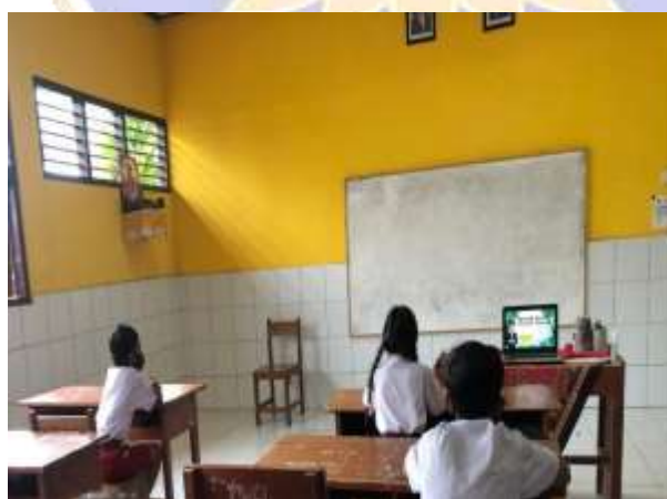
Gambar 02. Uji coba media pembelajaran pada siswa