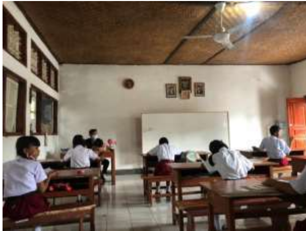
Gambar 03. Memberikan Penjelasan terkait kuesioner