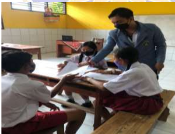
Gambar 05. Siswa mulai mengisi kuesioner uji kelompok kecil