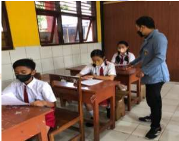
Gambar 04. Siswa mulai mengisi kuesioner uji perorangan