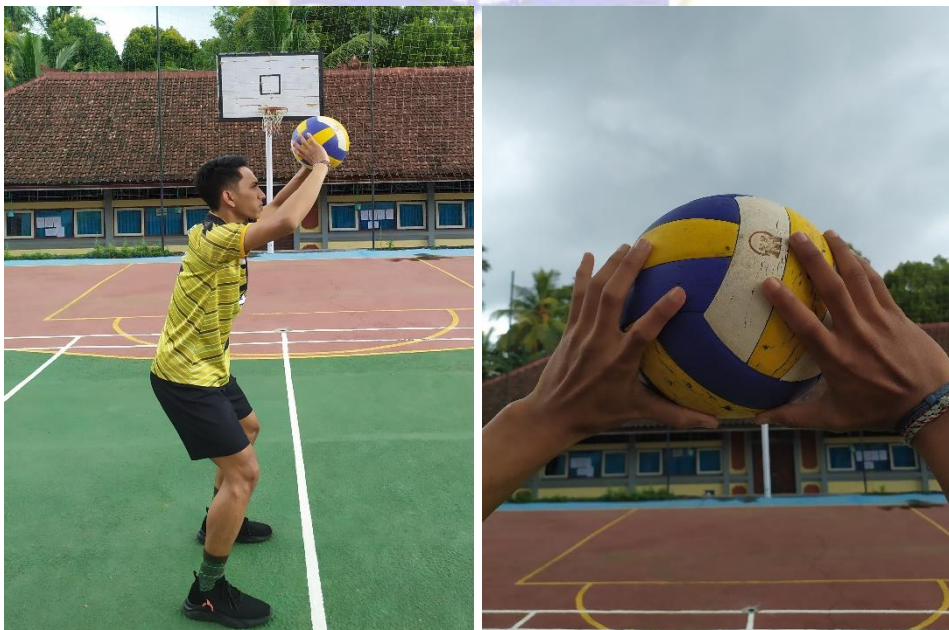
Gambar 02. Pelaksanaan gerak teknik dasar passing atas