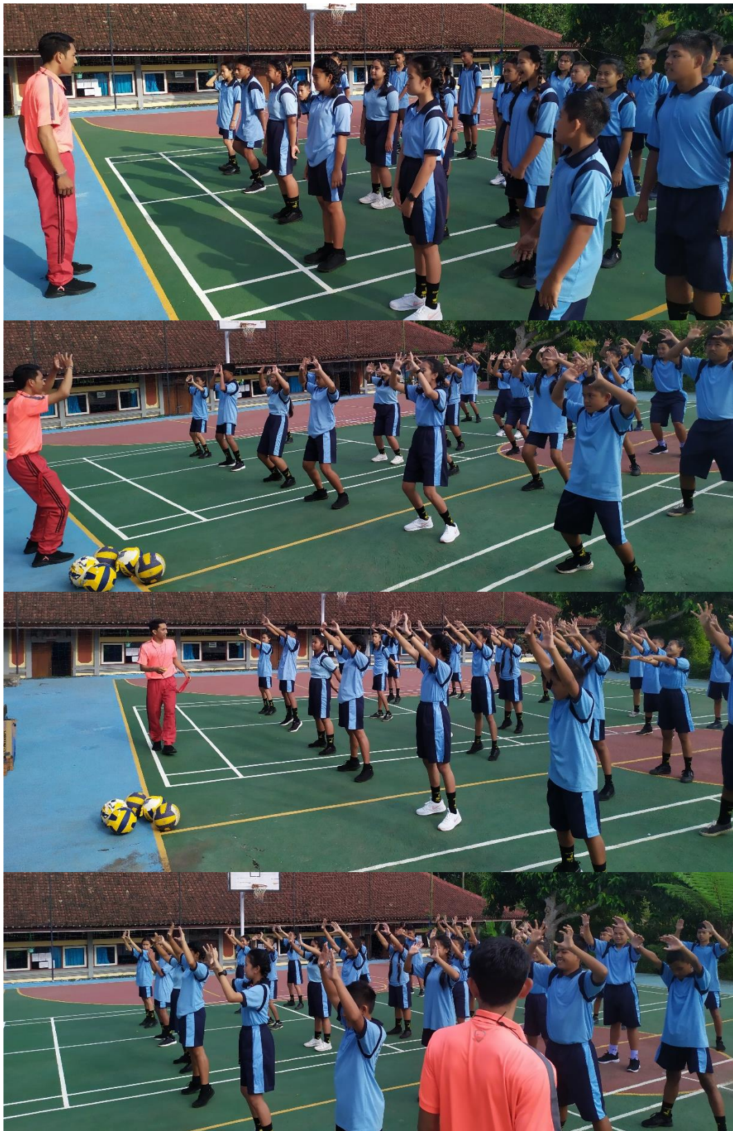
Keterangan : pertemuan kedua siklus II peneliti memberikan dan menjelaskan materi teknik dasar passing atas bolavoli kepada peserta didik, memberi instruksi kepada peserta didik untuk mempraktikkan teknik dasar passing atas bolavoli.