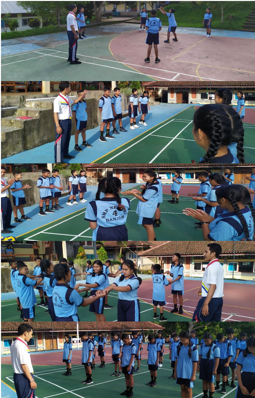
Keterangan : peneliti membimbing kelompok, memberikan evaluasi terkait proses pembelajaran, memberikan penghargaan kepada kelompok terbaik, memberi instruksi untuk melakukan pendinginan, menutup pembelajaran dengan doa.