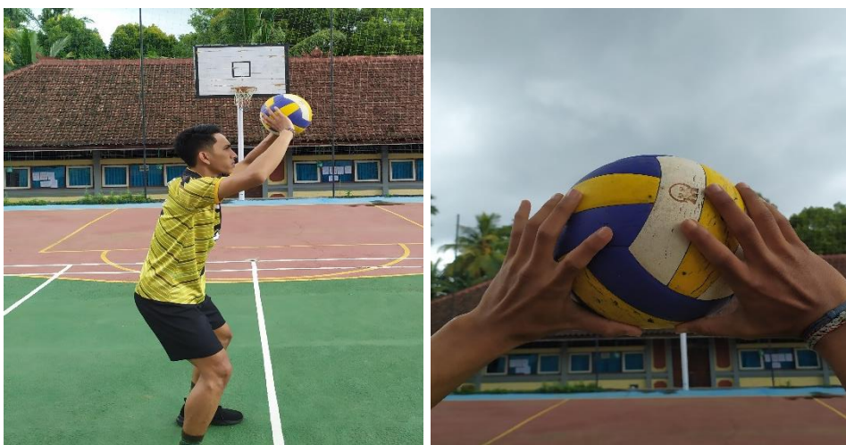
Gambar 02. Pelaksanaan gerak teknik dasar passing atas