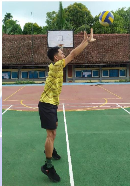
Gambar 03. Gerakan lanjutan teknik dasar passing atas