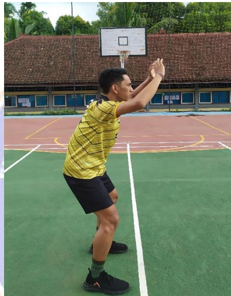
Gambar 01. Sikap awal teknik dasar passing atas