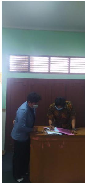
Gambar 3. Pelaksanaan Uji Praktisi bersama guru kelas 4 SD No 5 Jimbaran