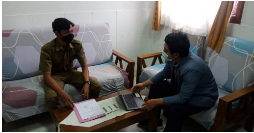
Gambar 1. Pelaksanaan observasi bersama guru kelas IV SD No 5 Jimbaran