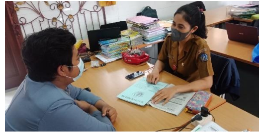
Gambar 2. Pelaksanaan observasi bersama guru kelas IV SD No 5 Jimbaran