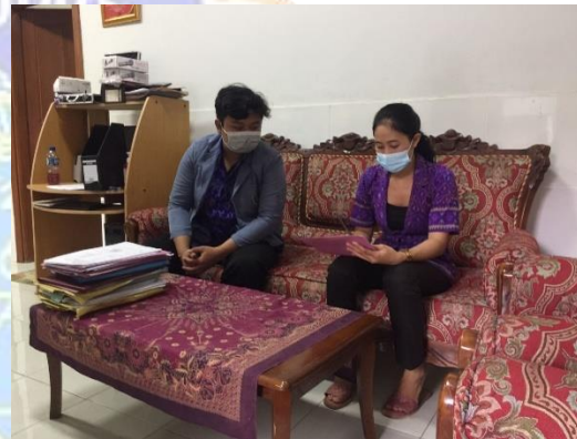
Gambar 3. Pelaksanaan Uji Praktisi bersama guru kelas 4 SD No 5 Jimbaran