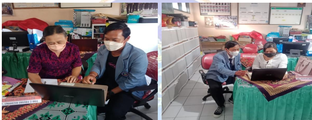
Gambar 2 Penilaian Ahli Praktisi