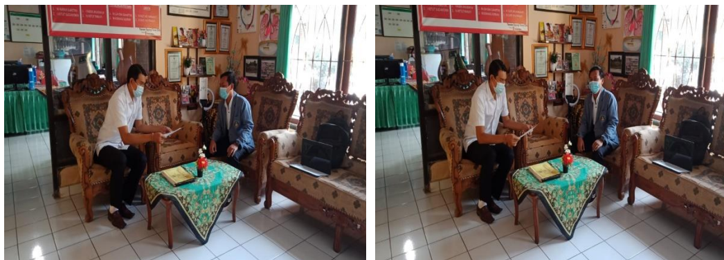
Gambar 1 Pelaksanaan Observasi di SD Negeri 1 Rendang