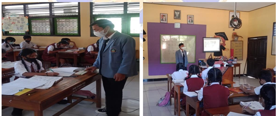
Gambar 3 Pemberian Penilaian Video Ke Siswa