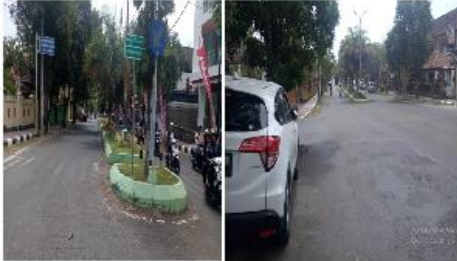
FOTO KONDISI JALAN PEMASANGAN RAMBU LALU LINTAS RUAS JALAN UDAYANA