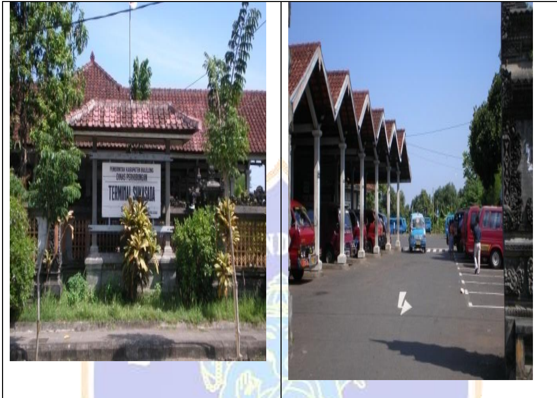
FOTO Petugas Dinas Perhubungan di Lokasi Parkir