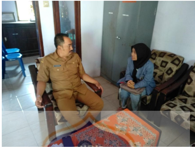
Gambar 1. Foto dengan Kepala Desa Alaskandang, Besuk Probolinggo