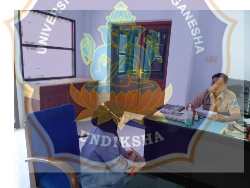
Gambar 2. Foto dengan Kepala PUPR Kabupaten Probolinggo