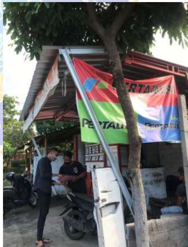
5. Wawancara Bersama Pemilik Pertamina