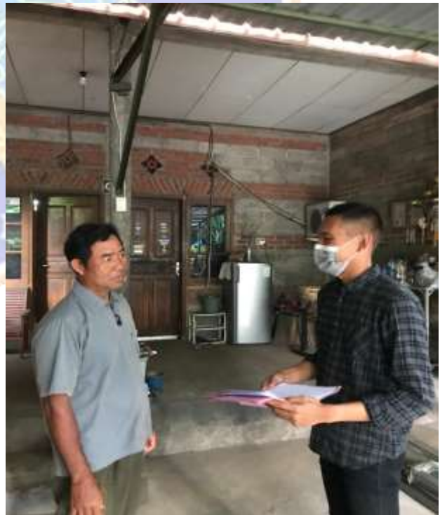
2. Wawancara Bersama Kabid Perindustrian