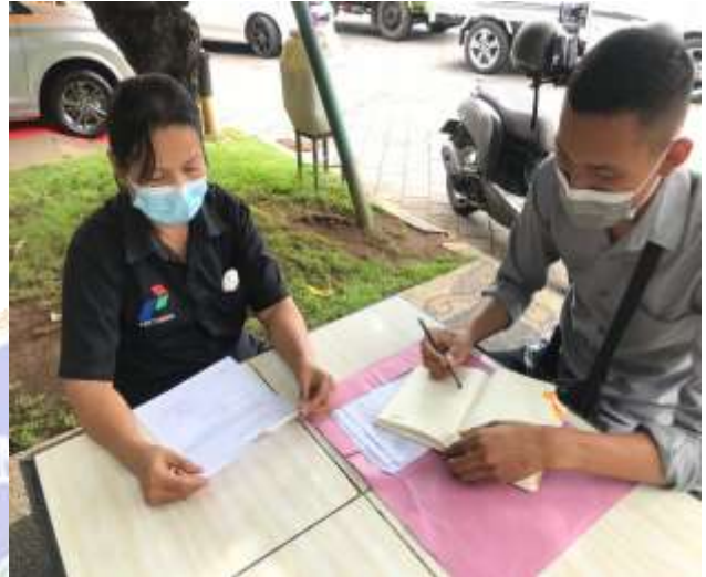
1. Wawancara Bersama Manager dan Admin SPBU Pacung dan Banyuasri