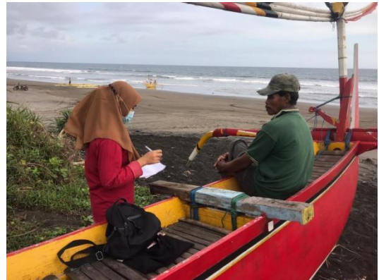
Gambar 6. Bersama Masyarakat Pesisir Desa Yeh Kuning