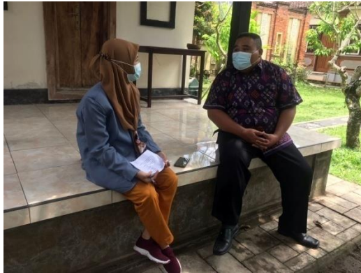
Gambar 5. Bersama Sekretaris Desa Penyaringan