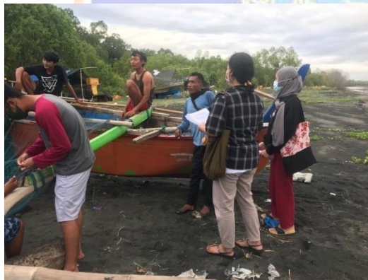
Gambar 3. Bersama Masyarakat Pesisir Pantai Candi Kusuma