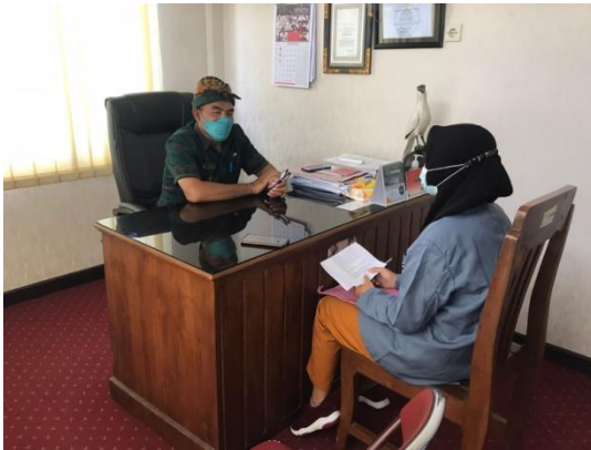
Gambar 1. Bersama Kepala Desa Desa Candi Kusuma