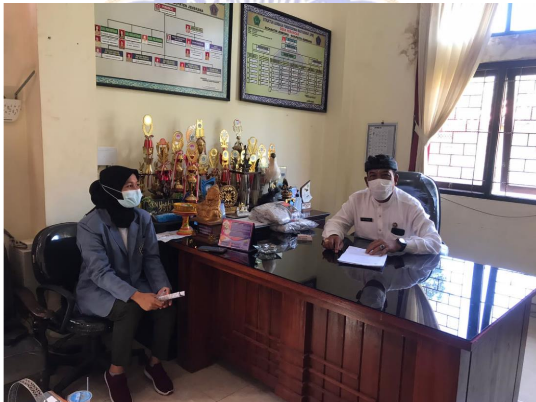
Gambar 7. Bersama Kepala Desa Perancak