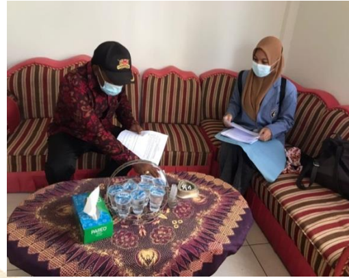
Gambar 2. Bersama Kepala Candi Kusuma Yeh Kuning