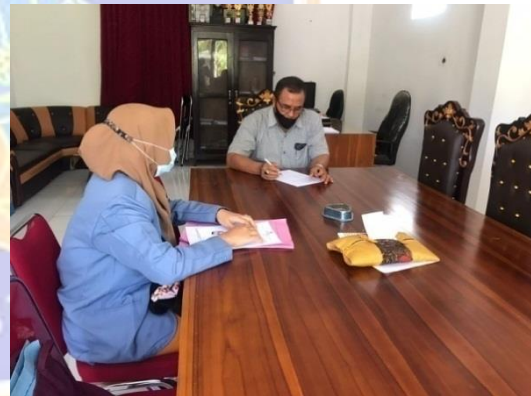
Gambar 4. Bersama Kepala Desa Cupel