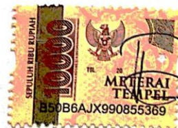
Kadek Dwi Paramita