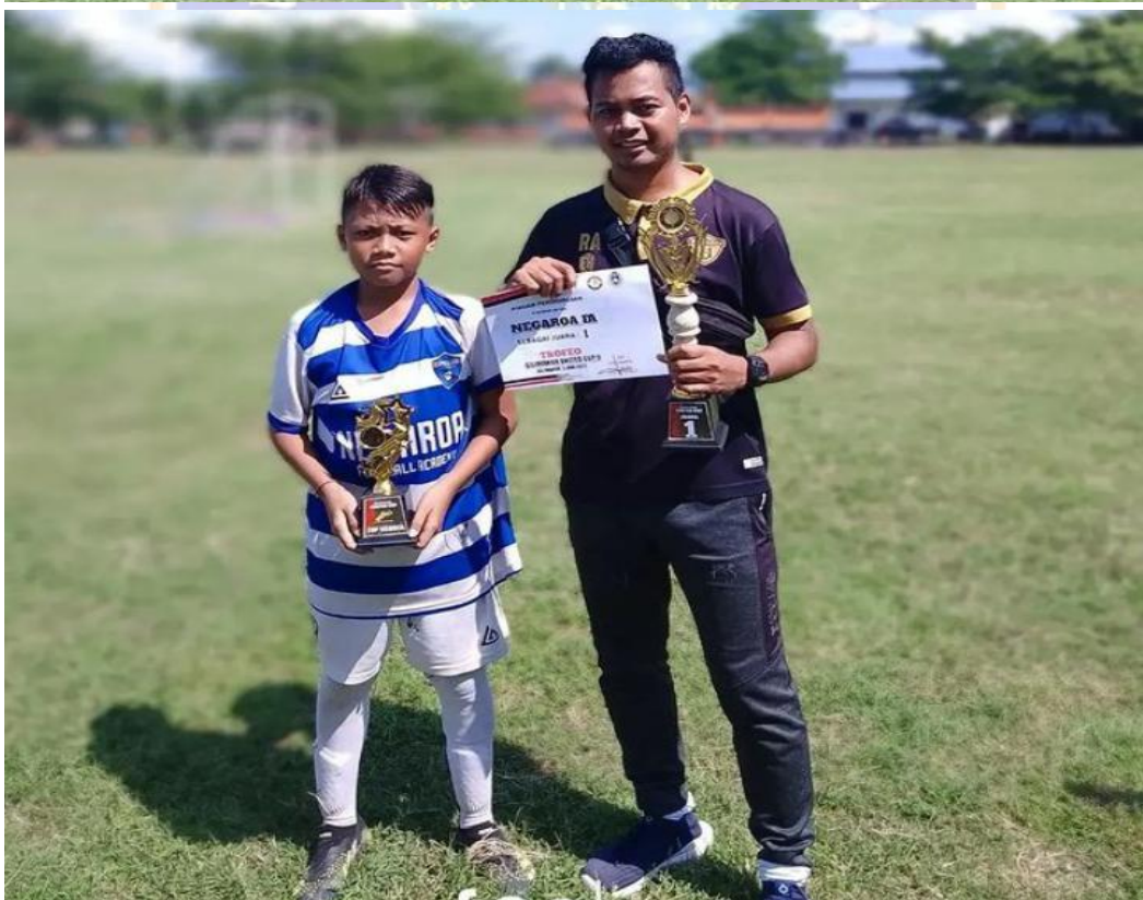
Gambar pencapaian prestasi Tim dan Individu di Negarao Football Academy