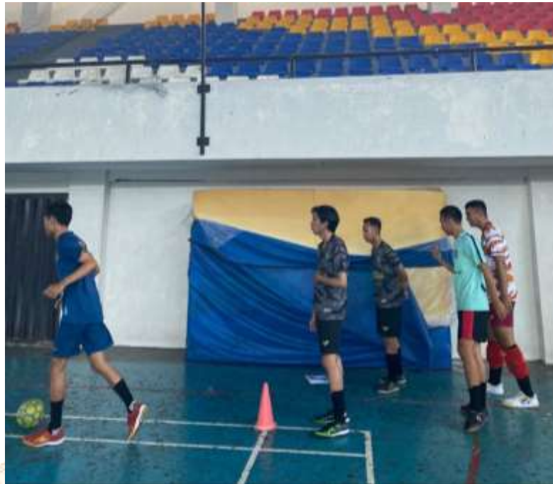
Pos2. Passing Without Controlling