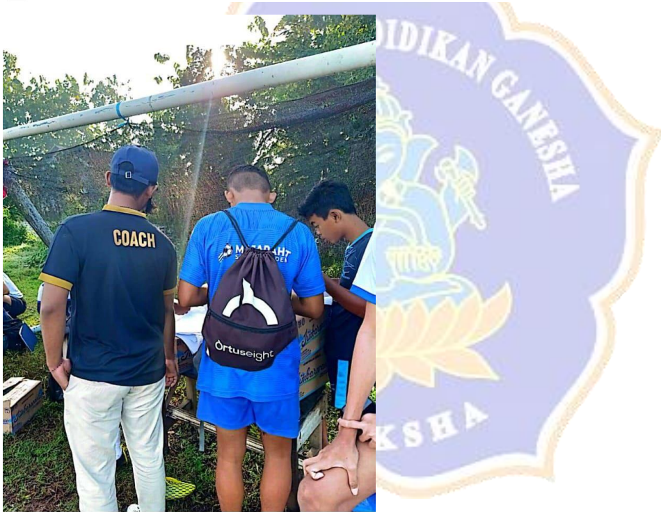
CS Dipindai dengan CamScanner