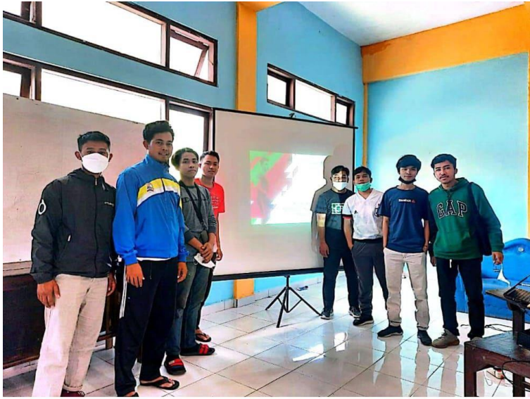
CS Dipindai dengan CamScanner