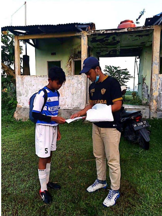
CS Dipindai dengan CamScanner