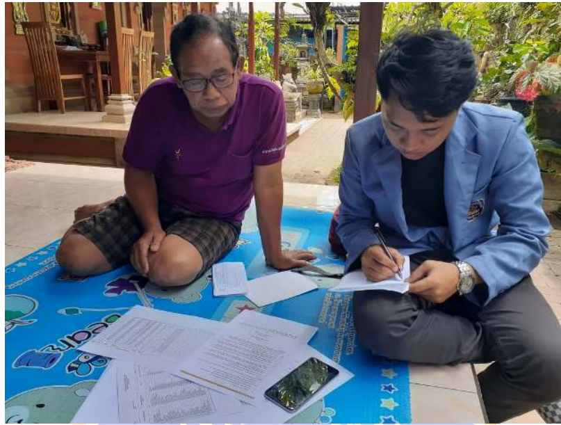
Wawancara dengan Bapak Suadnya Selaku Produsen Loloh cemcem di Penglipuran