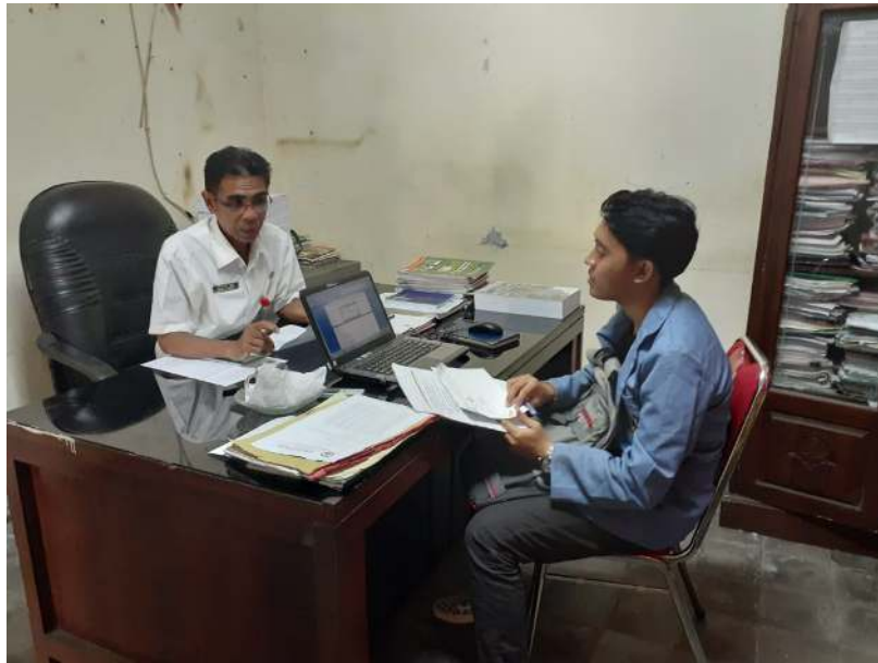
Wawancara dengan Sekertaris Badan Perindustrian dan Perdagangan Kabupaten